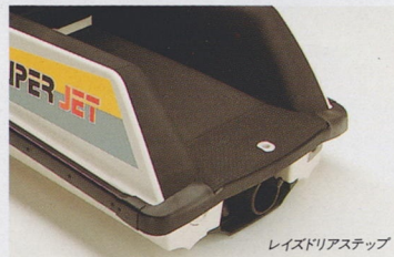
レイズドリアステップ