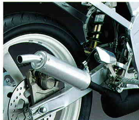
高効率を誇るレーシングチャンバー