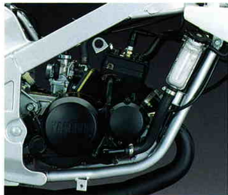
レーシングポテンシャルを得たパワーユニット