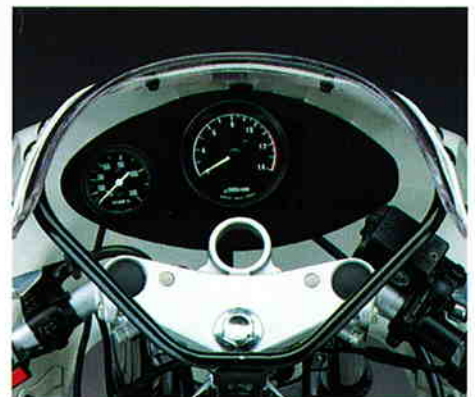
タコメーターと水温計を配した、精悍なメーターパネル