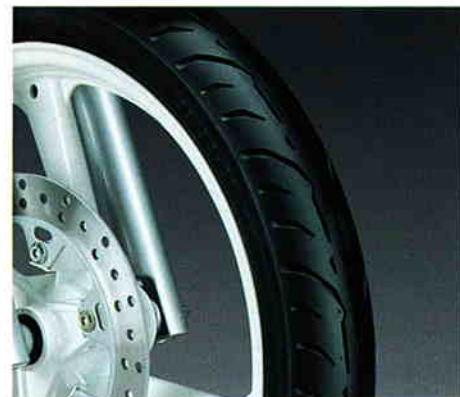
レース重視のハイグリップパターンタイヤ