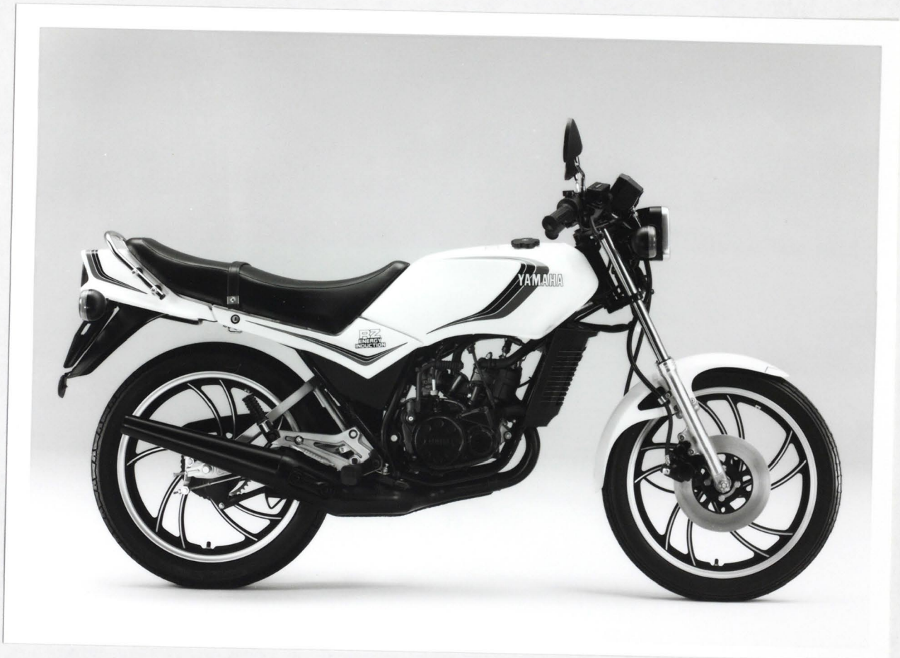
ヤマハ スーパースポーツ「RZ 125」