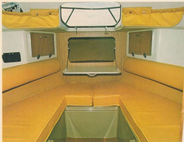
フォアキャビン＝落ち着いたイエロートーンの内装。防水加工のゴージャスなマットレス。ライトテーブル、マガジンラックが『海のリビングルーム』にふさわしい豪華さをかもしだしています。