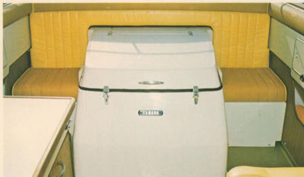
リアシート＝エンジンルームの両サイドにはビニールレザーのやわらかなシートを設置。涼風を頬に受けながら、ゆったりとクルージングをお楽しみいただけます。