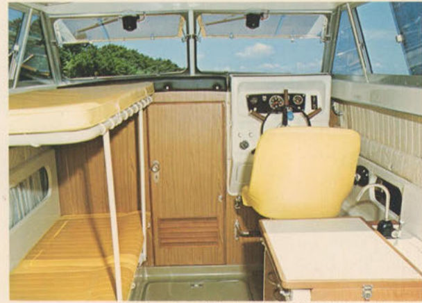
コックピット＝ハードトップに覆われた全天候タイプのドライコックピット。しぶきや雨に濡れることのない快適なボーディングをお約束します。