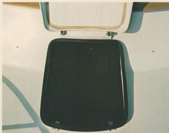
フロントハッチ=アンカー・ロープ等の保管に充分な広さを持った設計です。