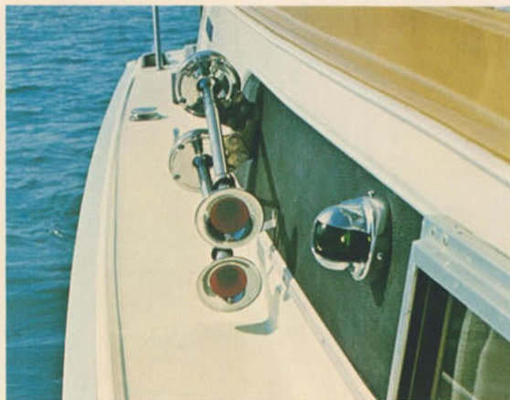
ホーン=軽快なダブルホーンはサイドビューの可愛いアクセサリとしても効果的です。