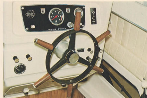
ステアリング＝ヘルムスマンの自信と誇りを託すステアリングはメカニカルが標準装備。計器ボックスも、見やすく洒落たゆりのある設計です。