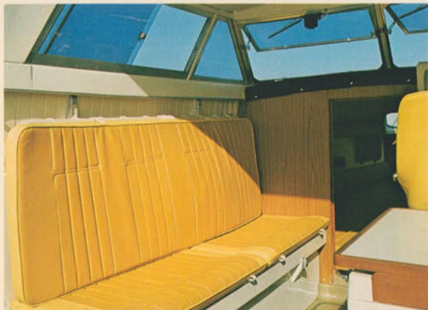
ソファベッド＝コックピットの座席はゆったりしたソファベッドタイプ。波間の読書やひる寝を存分に楽しめます。背もたれを上げると本格的な二段ベッドに早変わり。