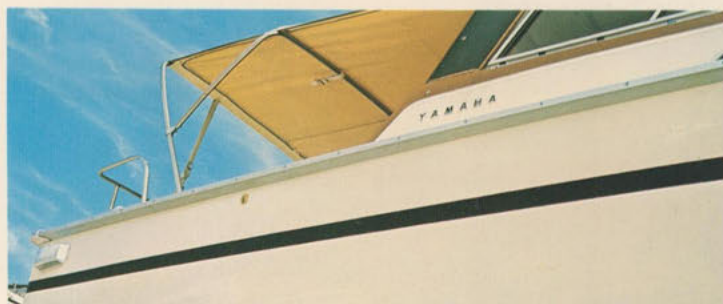
オーニング=着脱に便利なオーニング。日よけ、雨よけとして充分力を発揮します。