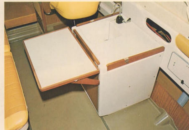
ギャレー＝ボーティングの楽しさを倍加するギャレー。釣果の調理に、船上パーティーの準備に……奥様の腕の見せどころ。テーブルは使いやすい開閉式です。