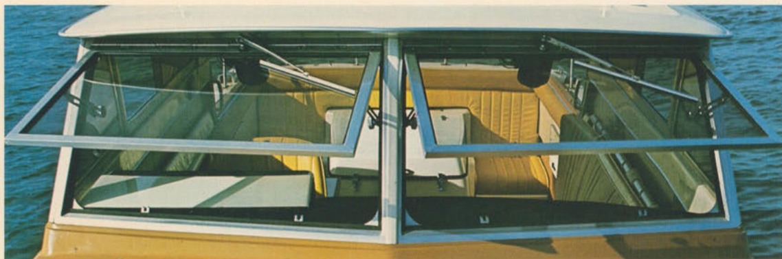
フロントガラス=前開きのフロントガラスは視界を広げて航海の安全性を高めるだけでなく、コックピットに十分な涼風を送ります。