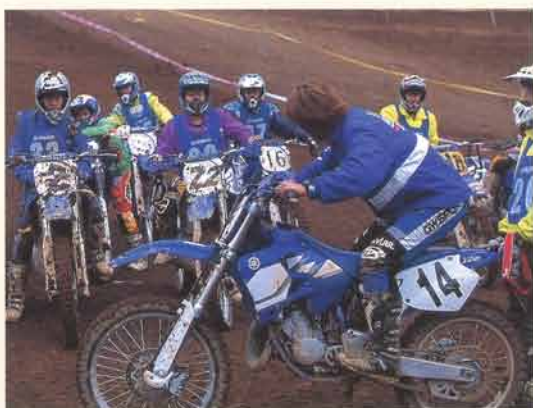
初日のエキストラモトクロステクニカルトレーニングは、ずらりそろったヤマハ契約ライダーが直接指導。生徒たちの真剣な眼差しに、講師も熱のこもったアドバイスで答え、最後にひとりひとり修了証を手渡して激励