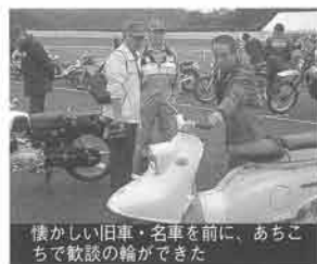
懐かしい旧車・名車を前に、あちこちで談話の輪ができた

公開する運びとなりました。しかし、当日はあいにくの雨。市販モーターサイクル25台、レーシングマシン9台、さらにトヨタ2000GTとOX99-11まで用意したものの、残念ながら二輪の公開走行はできずじまい。それでも雨に濡れながら待った熱心なファンのために、OX99-11がV型12気筒のF1サウンドを響かせながらデモラン。コースサイドで見守っていた来場者は、「これだけでも来た甲斐があったね」と顔をほころばせました。