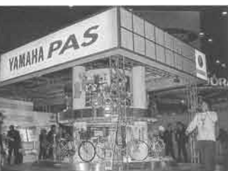
あらゆる人々の生活に密着した「PAS」ラインナップをアピール

幕張メッセの東京モーターショーが話題を集めるなか、東京ビッグサイトでは11月1日～3日まで「2001東京国際自転車展」を開催。「21世紀の環境・健康・感性を創造する自転車」をテーマに、24カ国から272社が出展し、過去最高の11万7000人の来場者で賑わいました。「世界にそして未来に広がる小型EVワールド」をテーマに掲げるヤマハは、電動ハイブリッド自転車の新提案モデル「Folding PAS」や好評の「パススマイル」シリーズ、「パススーパーライト」シリーズを始め、「マイメイト」「タウニパス」などの車いす商品まで、幅広いラインナップを展示。さらに、環境に配慮したこれからの交通社会作りの先駆けとなる電動自転車の共同利用・共同充電システムを提唱したエネルギー自立式電動ハイブリッド自転車運用システム「e-ステーション」をパネル展示するなど、ヤマハならではのパsworldを