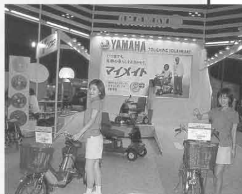
社会的な注目度の高まりを反映し、昨年を上回る13万4,000人が来場

また、11月から車いす周辺用品事業に参入したワイズギアも出品。ディスプレイキャラクターをあしらったスポークカバーやサイドバッグなど、車いす利用者の心を和ませるグッズが注目を集めました。