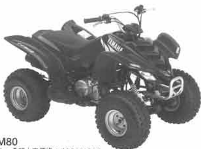
YFM80 メーカー希望小売価格：¥308,000 カラー：ディーパーブリッシュブルーソリッドE

タフでパワフルな79cm 3 ・4ストローク・単気筒エンジンを搭載し、クラス最長・1030mmのホイールベースと広いレッグルームを備えた車体が、ライダーの身長差や成長にも柔軟に対応。さらに、セルスターターや3速セミオートマチックミッション、メンテナンスフリーのシャフトドライブ、パーキングブレーキなどの採用で、日常的な取り扱いも容易です。