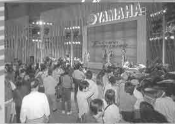
2002 Domestic New Models