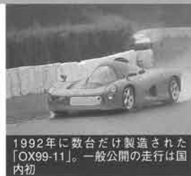
1992年に数台だけ製造された「OX99-11」。一般公開の走行は国内初

ヤマハ発動機では、このたび2000年度（2000年4月～2001年3月）の環境保全活動への取り組み姿勢と成果をまとめた「ヤマハ発動機2001年環境活動報告書」を発行しました。「Keep minimum」～最小限のエネルギー消費を守りながらお客さまの満足を追求するというヤマハの環境への取り組み姿勢を理解していただくため、昨年の発行に続く今回は、イラストを多用していっそう読みやすく表現。また、初めて「環境対応コスト」および「PRTRデータ」を公表し、内容の充実化をはかりました。さらに詳しく知りたい方には、工場別・製品別などの環境データを明記した「ヤマハ発動機2001年環境活動データブック（資料編）」も別冊で用意しています。入手をご希望の場合は、担当のヤマハセールスにご連絡ください。