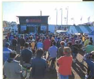
すっきりと晴れ上がった2日目は、スカラシップチャレンジカップレース。子どもから大人まで、さまざまな年代のPW、YZユーザーが集まってモトクロスの醍醐味を満喫した