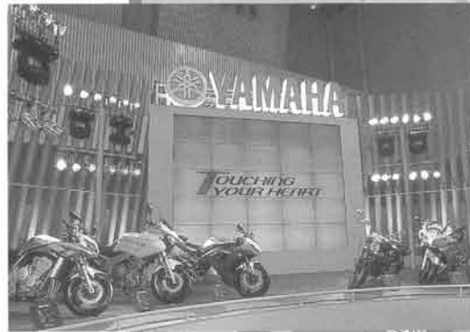
2002 Featured Models