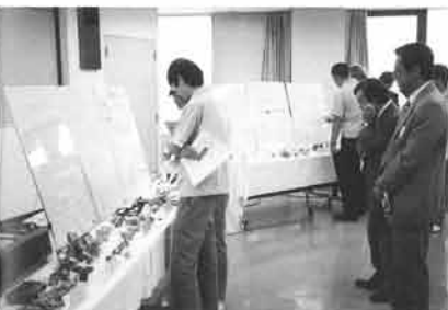
ヤマハは、株ミクニ製キャブレターやオイルポンプを製品に導入している

主催したヤマハ・購買本部では、社内の技術活性化に役立てば、と今後も同様の機会を設けていく予定です。