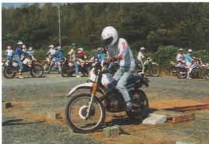
土手や古タイヤなど、その辺にあるものでセクション設定。簡単そうに見えるが、いくつかの難所も。競技方法はトライアルと同様

手軽に楽しめるオートバイの魅力を再確認するとともに、ボランティアで集まった社員運営スタッフとのコミュニケーションも良く、オートバイを介した企業と市民との親睦の場としても成果を納めたようです。