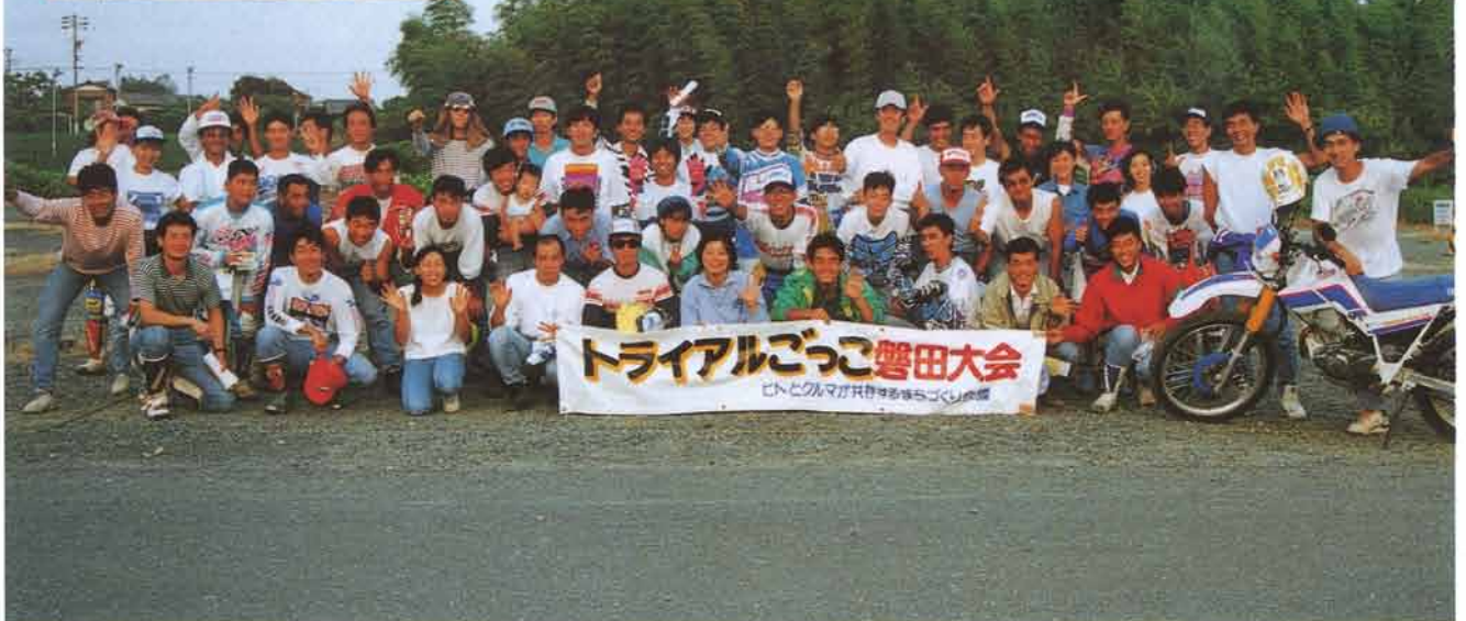
トライアルごっこ競技会に参加したみなさん