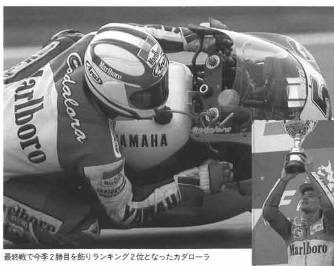
最終戦で今季2勝目を飾りランキング2位となったカダローラ

7ポイント差を追うカダローラは予選から好調で今季4度目のポールからスタート。この決勝レース、中盤には小雨が降り出すコンディションとなったが、カ