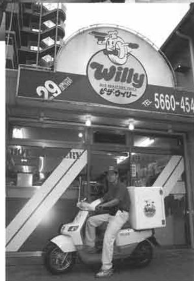
ビジネスバイクの新しいデザインを開拓したギア。ピザ・ウィリーの看板として、注目を浴びそうだ