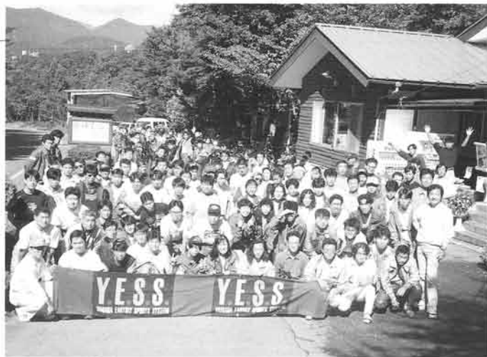
あいにくの雨で全員参加のイベントはできなかったが、それもまたよし？

そして夜は、お待ちかね飲み放題のバーベキューパーティーに突入。タンク投げの表彰式やプレゼント抽選会などで大いに盛り上がり、レジャーの秋を先取りする一日を満喫したようです。