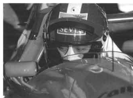
手に届きそうで届かなかった表彰台。鈴鹿こそ必ず…

ところが、ここからの走りはまるで別人。トップ2台に次ぐハイペースでラップを重ね、20周目あたりでは8位に浮上する。その後2度のピットストップをさみ、終盤7位に上がると、さらに6位