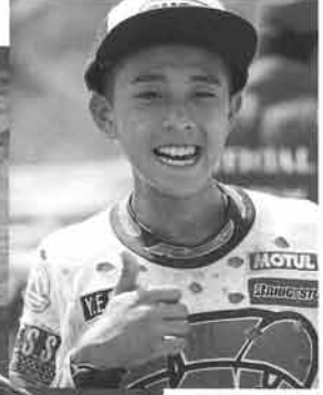
第9戦・SUGO大会は、修学旅行を途中から抜けての参戦