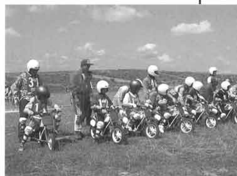
昨年のお好評に応え、今年は中部、関西、関東の3会場でのべ4日間に増やして実施

このイベントは、昨年初めて行なわれたものですが、子供ばかりでなく保護者のオトナも一緒に参加できるとあって大好評。9月25日、大阪北港・舞洲会場には116組の応募があり、そのなかから選ばれた20組41名が、モ-