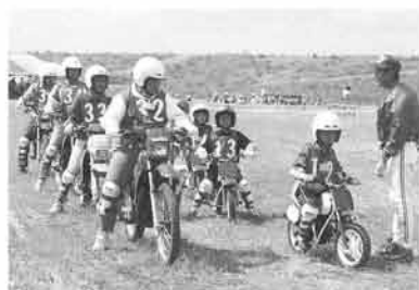
子供と一緒に走るお父さん、お母さんもやや緊張気味？

ターサイクルについての知識やルール、マナーを学び、ライディングレッスンで爽快な汗を流していました。