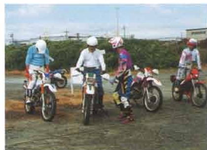
午前中は基本テクの練習。できる人ができない人を教える