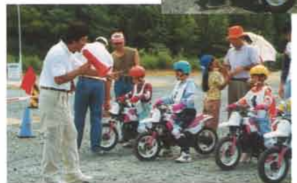
親子そろって参加の子供バイク広場。「楽しい」「子供との絆が深まった」と親子ともに大好評

良く整備されたナンバー付オフロード車であれば、メーカー、排気量、年式は不問。年齢や性別も問わず参加できることから、毎年回を重ねるごとに盛況さを増しています。