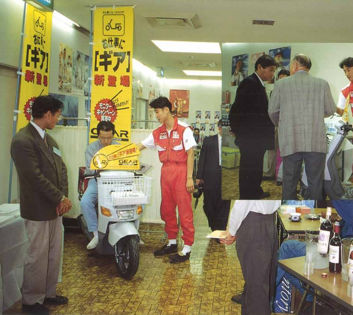
峰尾(株)さんの展示会では、予想した成果こそ上がらなかったが、酒販業界の様子を肌で感じる事ができたり、今後の販促展開に向けて貴重な経験となった

展示会に参加した酒屋さんを含め、約300枚のDMを展示会后10日で出し終えた。次のフォローは手作りDMと直接訪問を考えている。