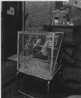
セキセイインコが出迎える店内。買う場所としてだけでなくリラックスできる雰囲気も大切な要素

見での入りにくさも否めない。では実際に店舗においてどのようなサービスを心がけているのだろうか。