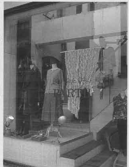
ショップは2階にあるため、入り口にある6体のディスプレイがお客様へのメッセージとなっている

アパレルメーカー15社の中からミセスやキャリア向けのカジユアル商品を取りそろえ、流行を押さえつつも、個性的な商品を提案している。メイインターゲットを30代から40代に想定している同店で