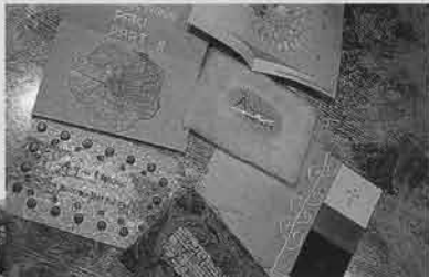
常連客へのダイレクトメールも手作りオリジナルのカードを作成している。ちいさな心がけが他店との差別化を図っていた