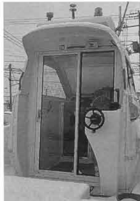
船外機艇の2ステーション化はキャビンのあるボートには必須の機装となっているようだ