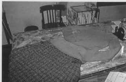
トータルコーディネートが同店の特徴。顧客ノートには、商品のイラストも盛り込まれている。新たな商品を提案するときはこのイラストが役立つという

は、ニットであれば1〜2万円、スカートであれば2万円前後の価格設定となっている。