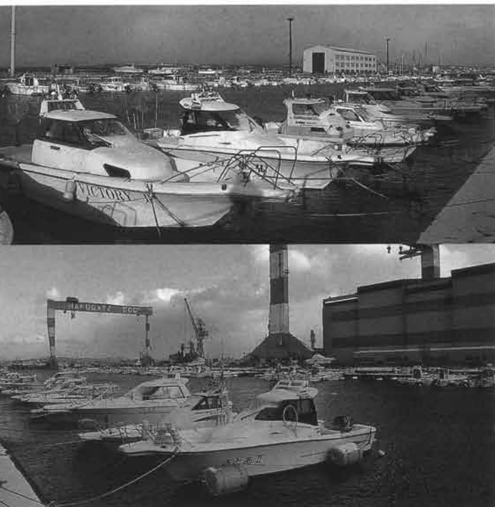
函館ドック内にある函館マリンパーク。UF系のポートが圧倒的に多い

YF-23をキーワードにポートの拡販に取り組まれている伊藤商会さん。UF-24を筆頭に代替え需要を活性化させたいと意気込みを見せていた。