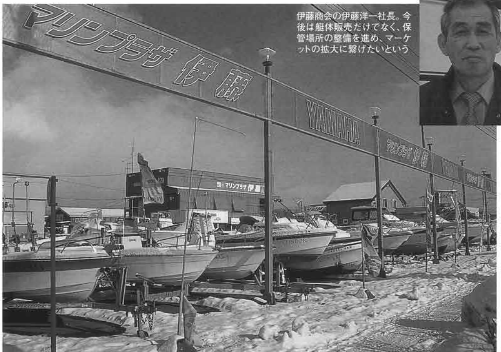
函館市郊外に店舗を構える伊藤商会さん。プレジャーから業務まで、マリンの総合ショップとして認知されている

とつ。ナビゲーションボックスの製作からドアに至るまで、FRPの成形などを自社で行えるため、ユーザーからの要望を積極的に取り入れている。