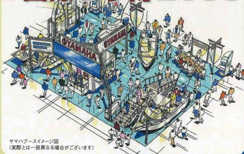
ヤマハブースイメージ図 (実際とは一部異なる場合がございます)