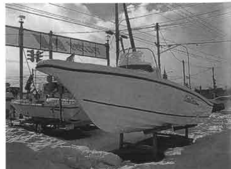
オープンタイプの中でもUF-21CCや26CCは函館でも人気がある。スタイリングとスピードがその理由となっている