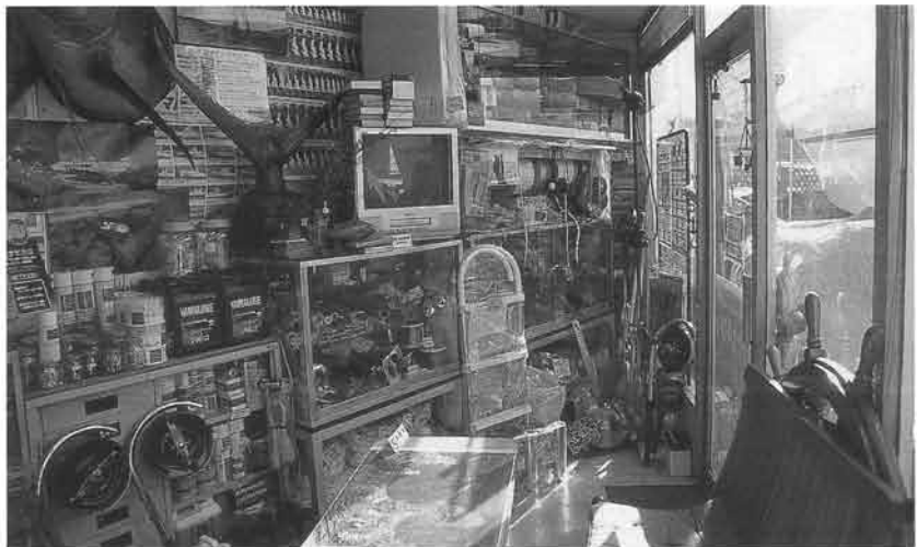
店内にはルアーなどの釣り用品からオイル等の消耗品、織装品までが取り揃えられている。「周辺にポートショップがないので、用品だけを買ってくるお客様も多いですよ」お客様の期待に応えられるショップでありたいという姿勢が品揃えに表れていた

「普通は、新艇が発売されてもベテランの方は厳しいことしかいわないのですが、このYF23に限ってはどなたも絶賛しているポートです。すでに2隻ほど決まりましたので、これを皮切りにどんどん販売していきたいですね」 YF23については2基掛けモデルが同社の主力商品として据えられている。低価格が拡販のキーワードとなっている。現在、100万ほど上回る2基掛けを主軸に据えている理由はどのあたりにあるのだろうか? 「このYF23だとパッケージ価格で100万円の差ですが、実際はシングルエンジンでも補機を望まれるお客様が多いので、60-70万円の差なんです。そこで、あとは試乗の時に乗り比べてもらう。試乗すれば、はっきりと違いのわかるポートですから、乗せることがそのままセールストークになる。またほとんどが代替のお客様になりますから、金額のことよりも、自分の遊びに合うかどうかになる。実際に東京湾で遊ぶ