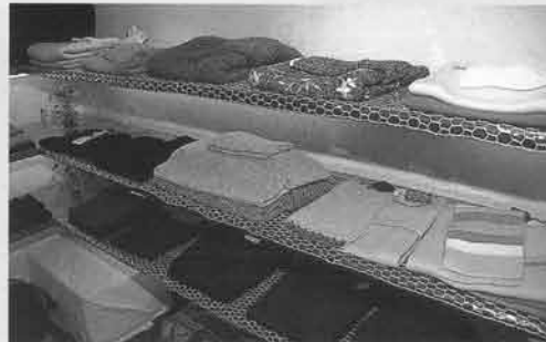
店内に置かれている商品はすべて1点もの。高い品質と落ち着いたデザインの洋服が多い