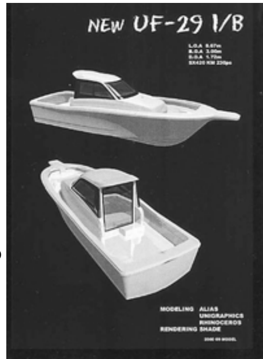
図 4 UF29 の 3D モデル

以上が型着手までのプロセスの大筋である。一貫して 3D でデザイン、設計を進めたのは今回が初めてであるが、1 つのデータを操作することで関係者どうしのコミュニケーションが取りやすい環境で仕事が出来たのではないかと思う。