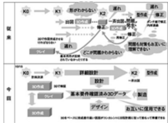
図 1 開発プロセスの違い

これを改善するために、開発の初期段階から 3 者が 3D データという同じ土俵で仕事を進めることとした(図 1)。