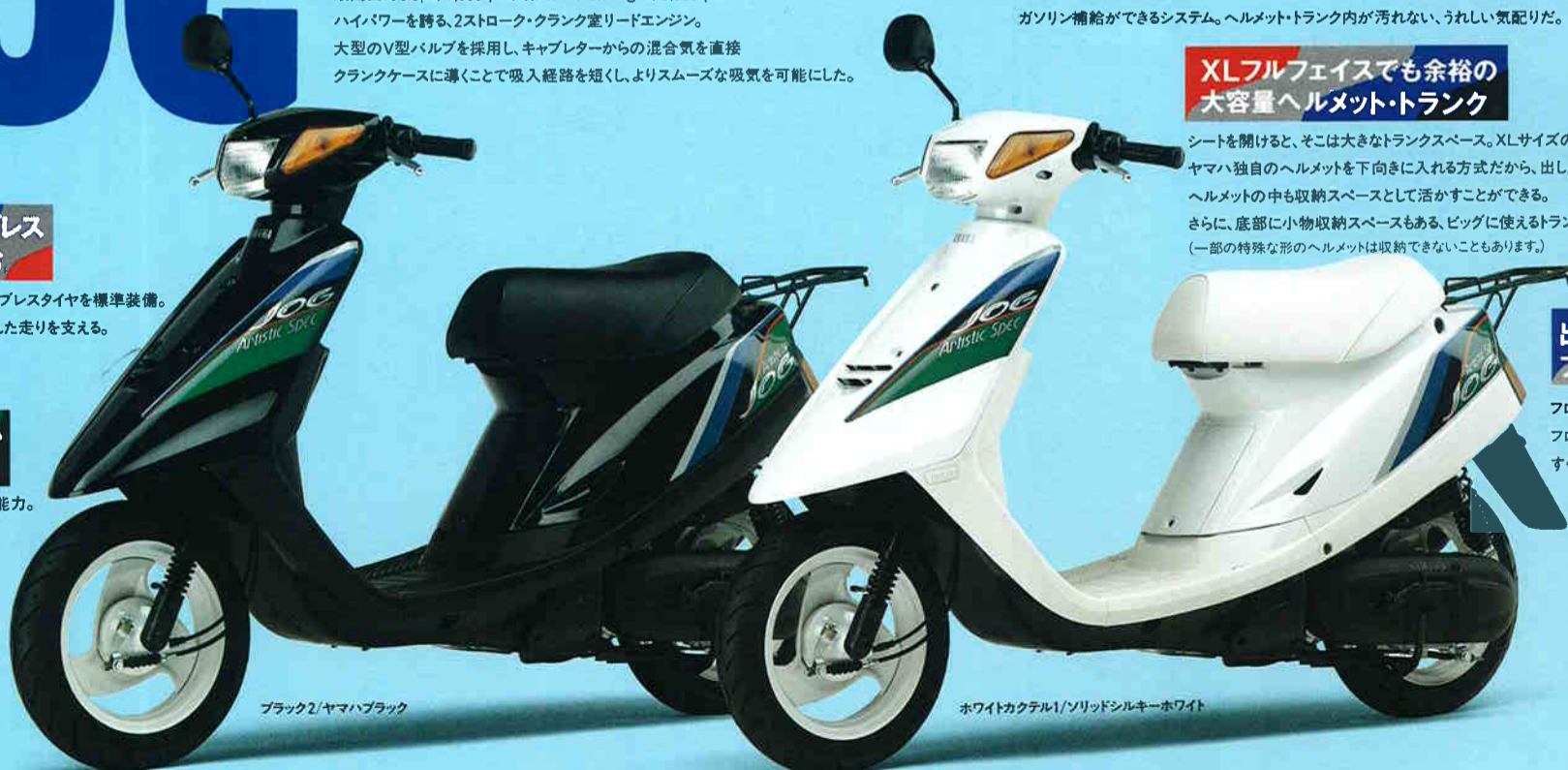
ブラック2/ヤマハブラック

ハイパワーに見合う、余裕の制動能力。前輪φ95mm、後輪φ110mmの大径ブレーキを採用。