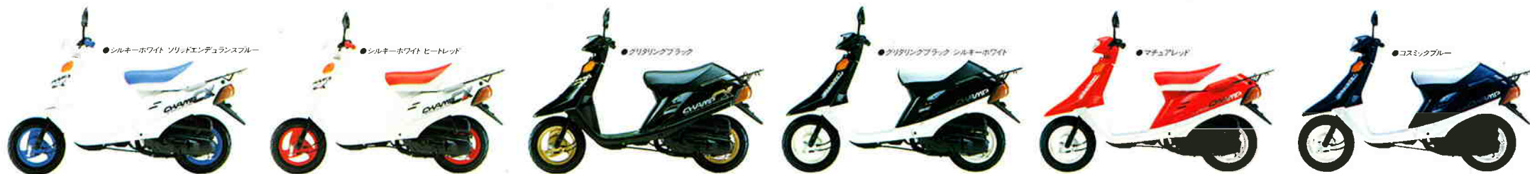
●シルキーホワイト ソリッドエンデュランスブルー