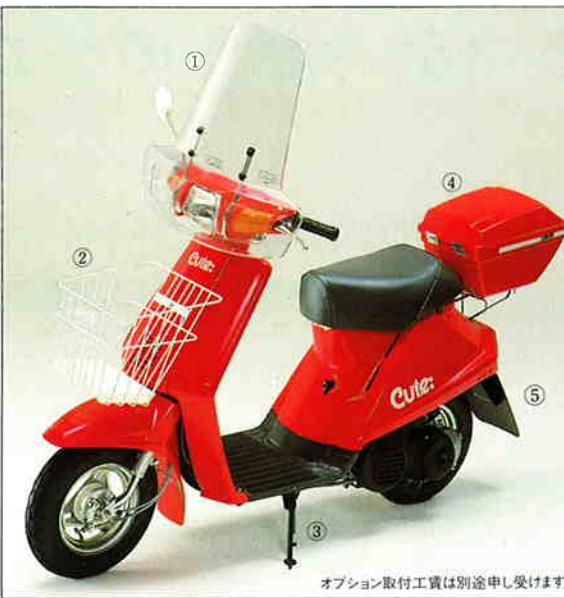
オプション取付工賃は別途申し受けます。