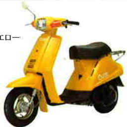
ソフィアイエロー