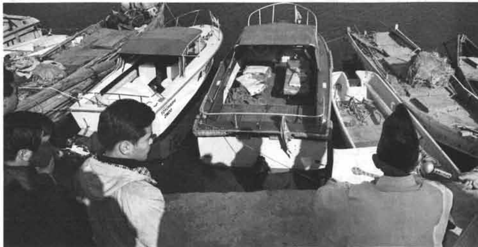
年明けてはじめてのクルージング、神主さんに今年の安全をお願いしました。