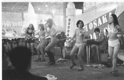
▲夏を招くビキニ娘のゴーゴー。