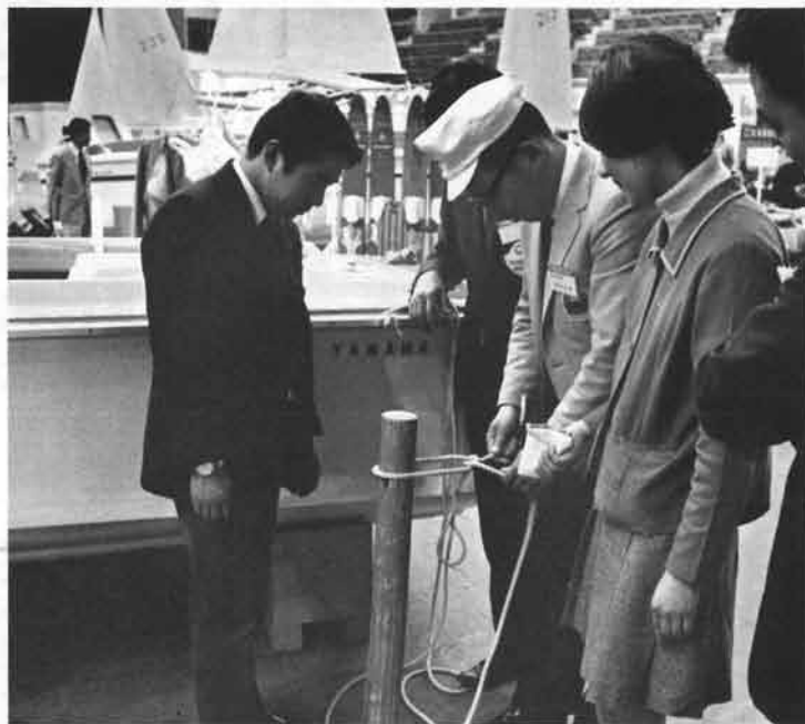
ロープワークコーナーはボートマン、ヨットマンビギナーに好評

東北のマリンレジャーのメッカ、松島湾を控えている仙台では、近年、レジャー用ボート、セーリングボートのファンも大巾に増加、今回のショウも、三日間におたり、延二、五〇〇名のお客さまを迎え、春遅いみちのくに夏のような熱気をもたらしました。 また、会場でのセーリング教室の申し込みも多く、ボート試乗会なども人気を博し、さいさきのよいスタートをきりました。