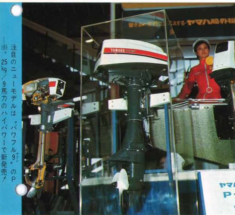
注目のニューモデルは「パワフル9」のP-165。25kg/9馬力のハイパワーで新発売!