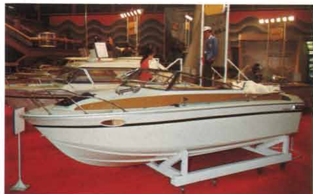
走行スタイル抜群の高速艇STR-20SCR。デッキのストライプがひときわ印象的だ。