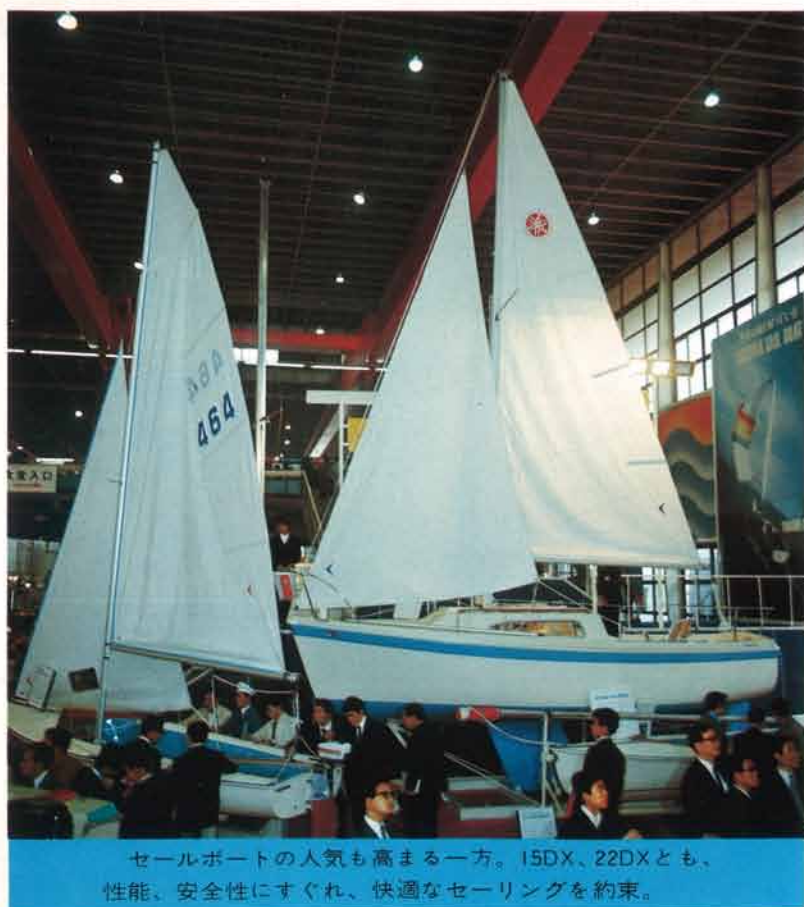
セールボートの人気も高まる一方。15DX、22DXとも、性能、安全性にすぐれ、快適なセーリングを約束。