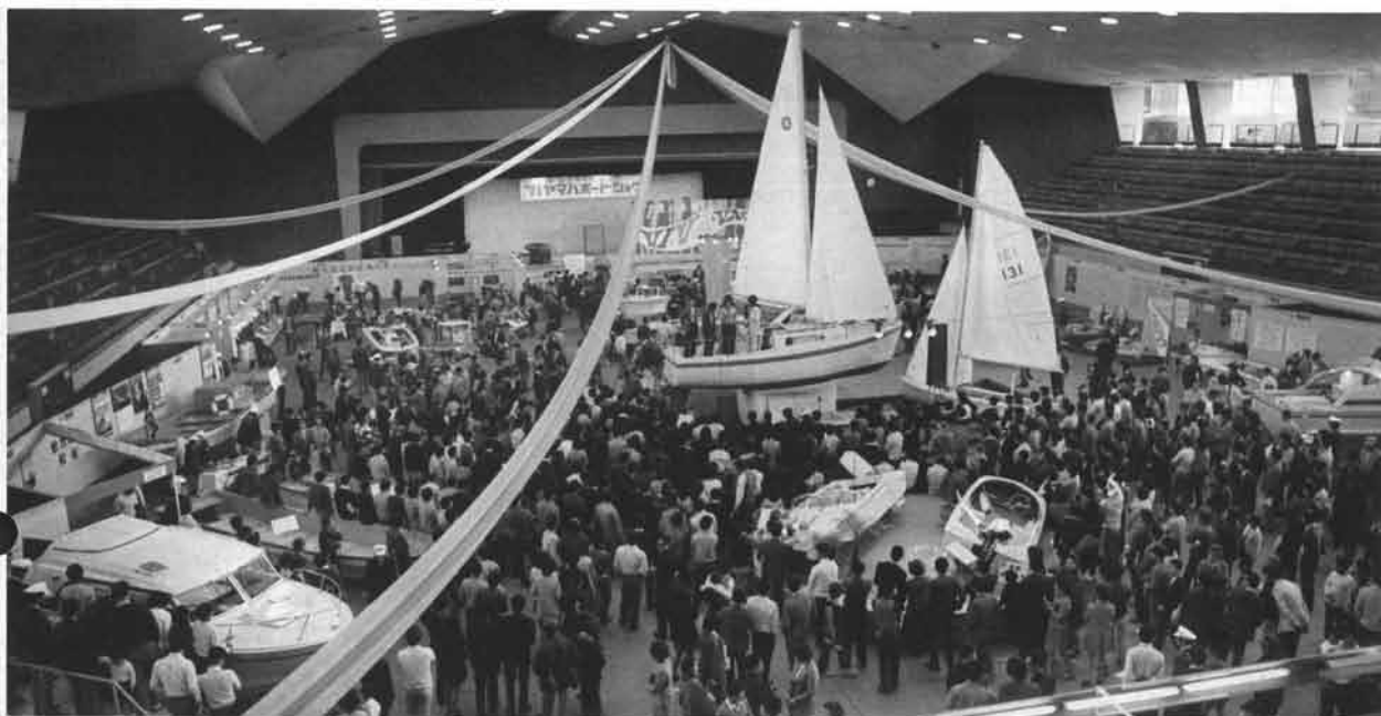
ワッとあつまった人、人、人の注目をあつめたのはセールボート