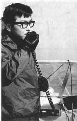
CQ CQ コチラ JA……無線のテストも上々です。

やわらかな早春の陽を一杯に受けて、名古屋地区のヤマハマリクラブの人々が、佐久島周遊のクルージングを行いました。 この日は、春先に特有のガスもなく、青い空と、おだやかな三河湾に囲まれた絶好のクルージング日和り。アマチュア無線の海上テストを兼ねて、知多マリーナから出発したボートを、西浦マリーナからのボートが交信しながらクルージングを行い、目的地佐久島で時間通り合流という、大成功のテスト結果でした。 また、ボカボカとした陽のこぼれる佐久島では、神主さんを迎えて、ボート始めのお祓いをしたり、昼食を囲んでのクラブ員交歓会の催しなど、日帰りクルージングとしては盛沢山の行事に、春の一日を楽しく過したものでした。