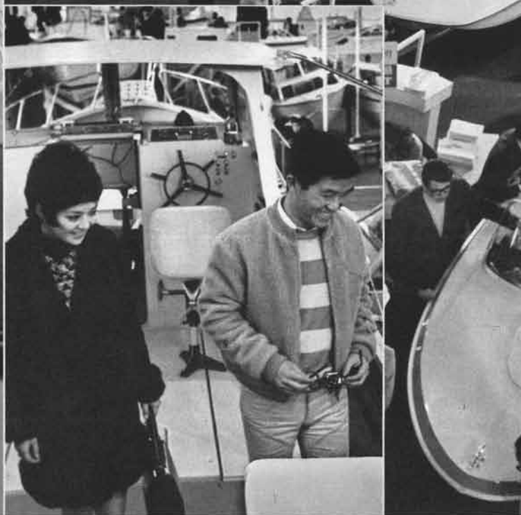
▼下を向いて歩いているのはおなじみ坂本九さん。新発売のフィッシングクルーザーFC-40に魅せられた感じ。