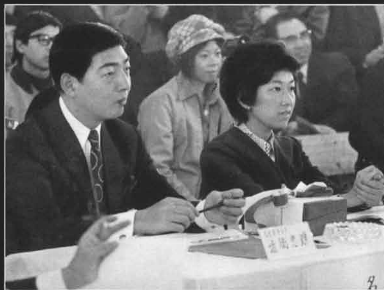
▲「ミス・マリン」コンテストの審査役を楽しくつとめられた近衛忠輝ご夫妻。