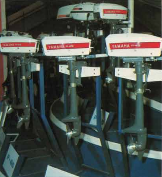
ヤマハミニの愛称で親しまれているP-45。重さわずか9kg。1.5馬力の本格派水冷式。