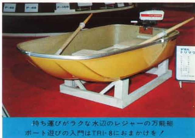
持ち運びがラクな水辺のレジャーの万能艇。ボート遊びの入門はTRI-8におまかけを！