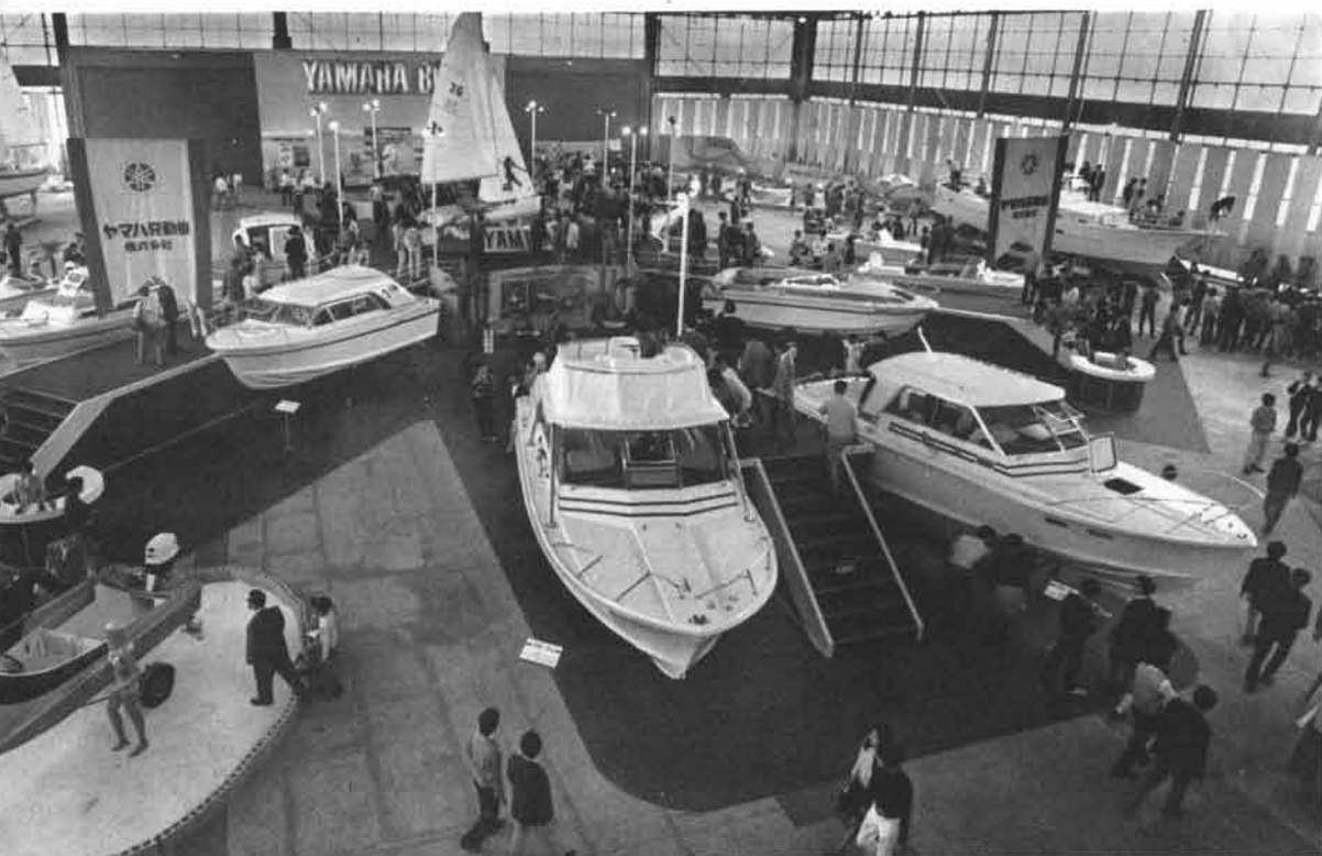
さすがのナニワッコもビックリ!? 会場の人気を独占したヤマハコーナーの大デモンストレーション