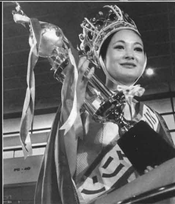
▲海の女王「ミス・マリン」の誕生はここのしのショーの新しい話題。こほうびはハワイ旅行。