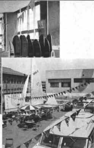
北店では、広い前庭を利用して、青い天井の雰囲気も十分！

毎年、はなやかなボートテイキングプランをみだす名古屋支店のもとで開かれた名古屋ボートショーは、会場を細かく分散、密度の濃内容が展開されました。今年は、新年早々の、ウインタークルージングで早くも夏の本格的クルージングへの小手調べなどを催した心意気は見上げたもので、会場でもボートを前にして、熱っぽい言葉が飛びかう雰囲気でした。