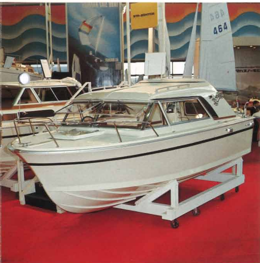
待望のオールシーズンボートの登場。20-HT-CRは耐波性にすぐれ、荒天にもその偉力を発揮して豪快なボーティングを楽しめる。