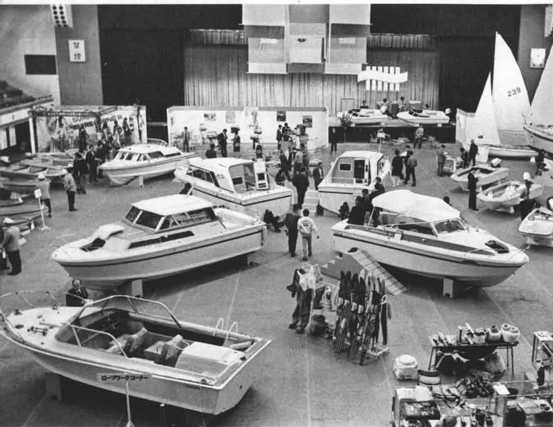
本格的なレジャーボートブームを呼び起こす会場一杯に堂々と飾られたヤマハボートのオンパレード