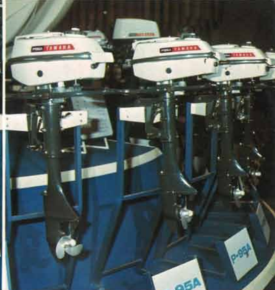
ねばり強さで定評あるアルミシリンダーの高性能5馬力エンジンがP-95A。重さ20kg。