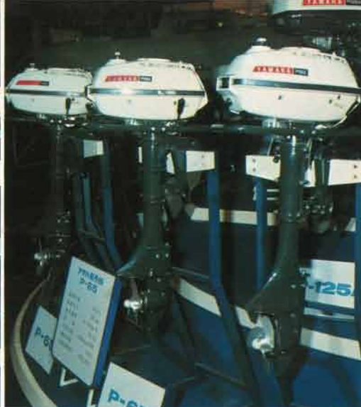
扱いやすい前面操作方式、釣糸巻付防止装置付のP-65。重さ15kg。3.5馬力。