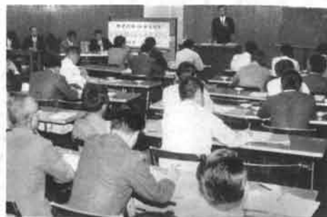
早くも九州、別府では82人の講習生を迎えて、本格的な「小型船舶操縦士」免許講習会が開かれ、若い人の関心を集めました。