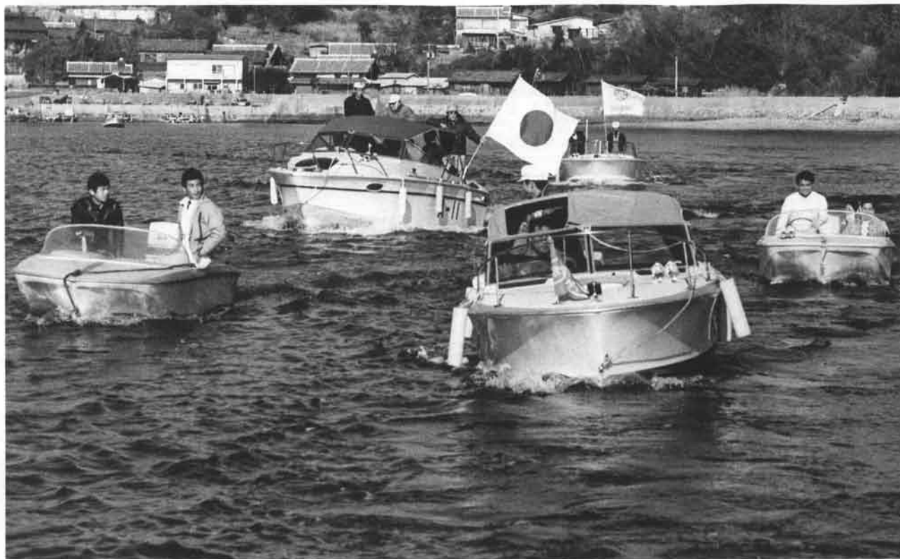
うらかな春の一日を、いざクルージングへ！ 日の丸を先頭にすすむヤマハ艦隊。

やわらかな早春の陽を一杯に受けて、名古屋地区のヤマハマリクラブの人々が、佐久島周遊のクルージングを行いました。 この日は、春先に特有のガスもなく、青い空と、おだやかな三河湾に囲まれた絶好のクルージング日和り。アマチュア無線の海上テストを兼ねて、知多マリーナから出発したボートを、西浦マリーナからのボートが交信しながらクルージングを行い、目的地佐久島で時間通り合流という、大成功のテスト結果でした。 また、ボカボカとした陽のこぼれる佐久島では、神主さんを迎えて、ボート始めのお祓いをしたり、昼食を囲んでのクラブ員交歓会の催しなど、日帰りクルージングとしては盛沢山の行事に、春の一日を楽しく過したものでした。