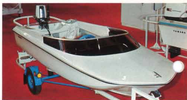
軽快な海のスポーツカーともいうべきTRI-12SDXは特に若い人達の人気を集めた。