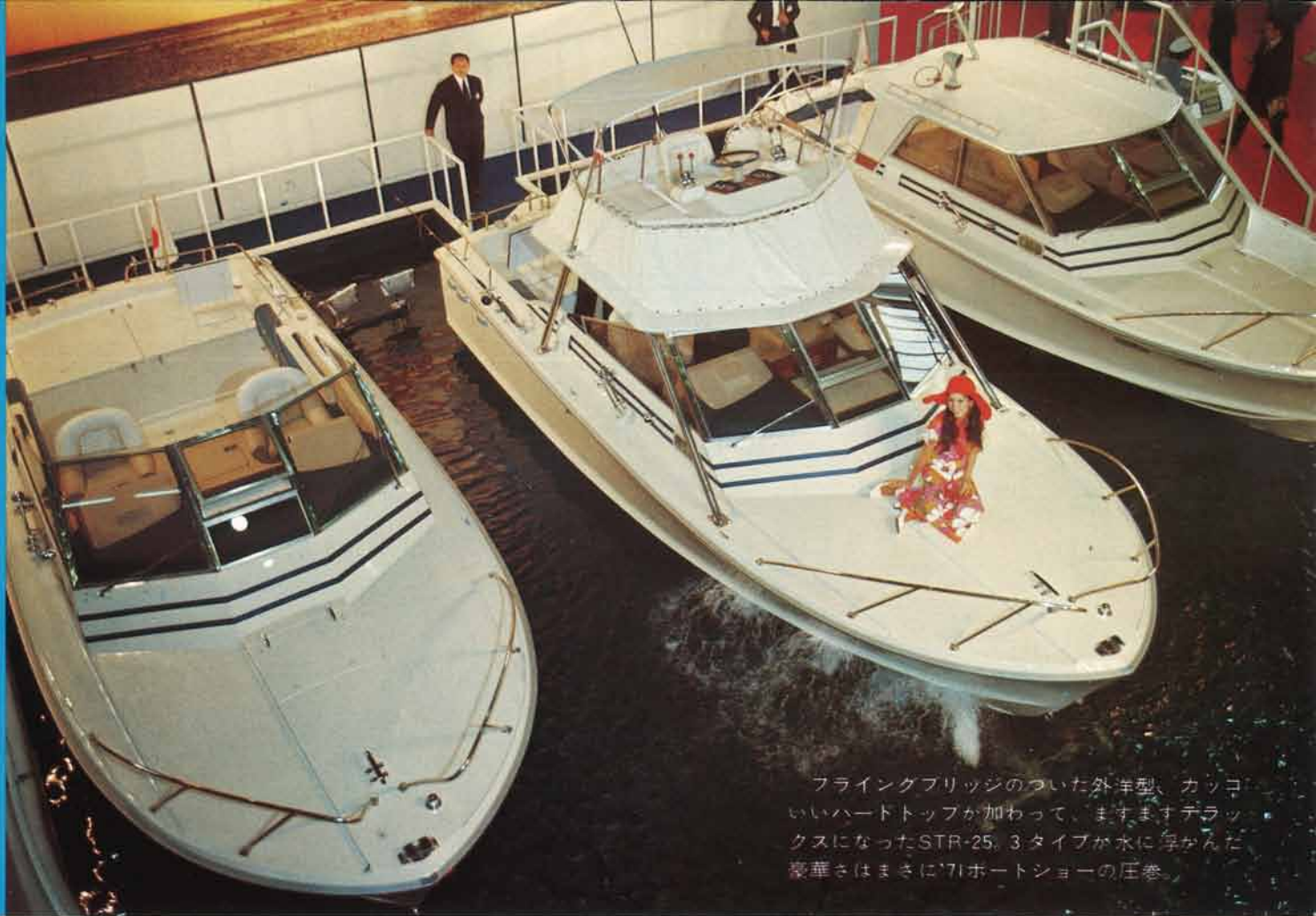
フライングブリッジのついた外洋型、カッコいいハードトップが加わって、ますますデラックスになったSTR-25。3タイプが水に浮かんだ豪華さはまさに'71ボートショーの圧巻。