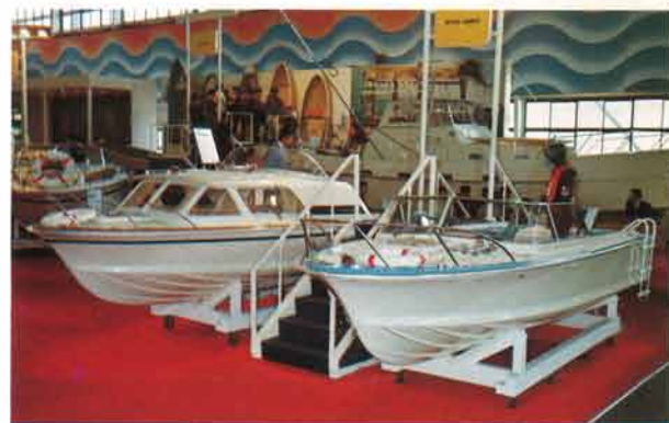
日本の海はもうすっかりおなじみのSTR-18。キャビンクルーザーのパイオニアである