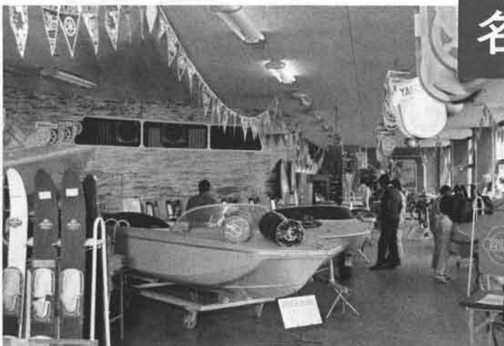
▲東新店ではショールームを利用したのショー、気楽に見れると好評。