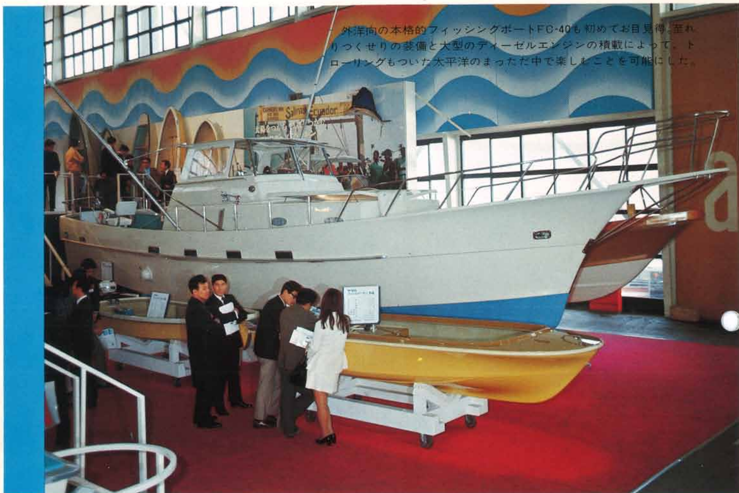
外洋向の本格的フィッシングボートFC-40も初めてお目見得。至れりつくせりの装備と大型のディーゼルエンジンの積載によって、トローリングもついた太平洋のまっただ中で楽しむことを可能にした。