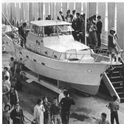
▼“ガッツな船やナー..と感嘆の声のみノ

’71大阪ボートショーは、デイリースポーツ社の主催で4月25日より5日間、港区田中の大阪見本市恒久展示場2号館で開かれました。 ボート、ヨット80艇、船外機150台を中心にマリン用品など42社が出品してけんを競いましたが、ヤマハはセールボート36をのぞく’71型全製品を出品、広い会場の半分を占めてトップメーカーとしての実力を示しました。なかでもFC40がたいへんな人気を呼び、ビッグレジャー時代の到来を告げて