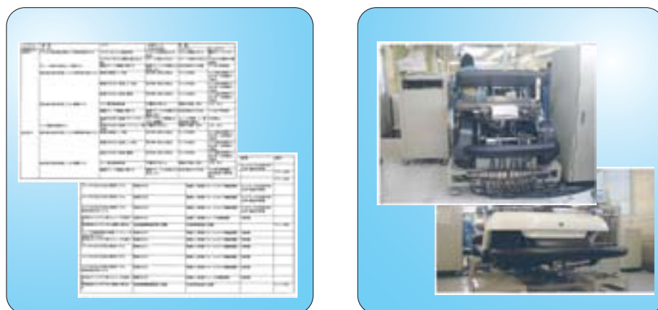
図 2 電磁エレキ車用コントローラの設計 FMEA と完成検査状況

取引先とのコミュニケーションで、テストコースでの相互確認評価もお互いに納得がいくまで行いました。完成検査にて特に配慮した事は、市場に出た初期トラブルを無くす為、ラインに設置された実機を使用してのソフト / ハードのチェック及びハンダ付け不良の検出でした。図 2 は、電磁エレキ車用のコントローラに対し実施した設計 FMEA と完成検査の実施状況を示します。