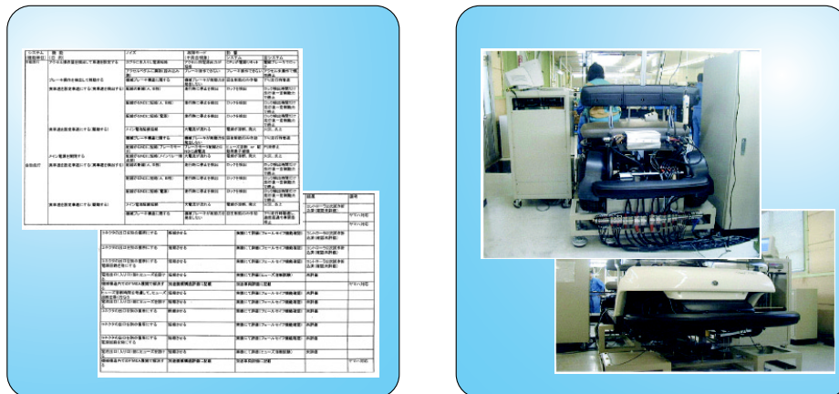
図2 電磁エレキ車用コントローラの設計 FMEA と完成検査状況

取引先とのコミュニケーションで、テストコースでの相互確認評価もお互いに納得がいくまで行いました。完成検査にて特に配慮した事は、市場に出での初期トラブルを無くす為、ラインに設置された実機を使用してのソフト/ハードのチェック及びハンダ付け不良の検出でした。図2は、電磁エレキ車用のコントローラに対し実施した設計 FMEA と完成検査の実施状況を示します。