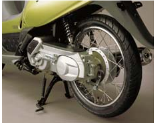
図 11 エンジン