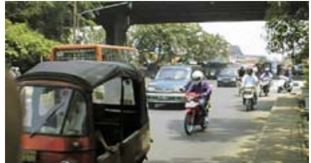
図3 ジャカルタでの試乗

コンセプトのブレークダウンは全ての目標項目の数値化を行い、縮尺モデルを使用しての市場調査も合わせて行うことで、スタイリングの方向性検証も実施した（図6）。