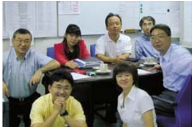
図13 現地 CE メンバー