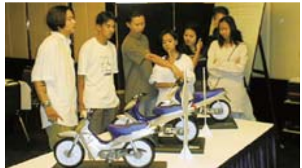
図6 縮尺モデルを使用しての市場調査 (タイ、チョンブリの高校生への調査)