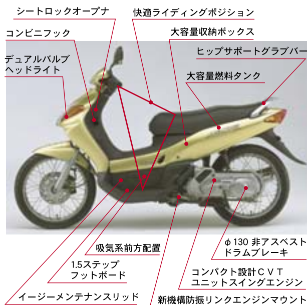
図2 NOUVO フィーチャーマップ

ASEAN 各国では、通勤通学等のいわゆるコ ミュータとして、通称モペットと呼ばれる遠心 クラッチ付きアンダーボーン型モーターサイクルが 社会性をもって市民生活に確実に根付いている。 ヤマハ発動機はかかる市場に対し、既存商品と共 生も出来、なおかつ新しい付加価値でより快適な コミュータを提案すべく、NOUVO を市場投入した のでその概要をここに紹介する（図1、図2）。