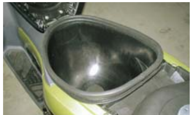
図8 大容量収納ボックス

手元操作のシートロックオープナーを装備したシート下17L大容量収納ボックス（図8）、自由度のあるフットボード、操作し易く十分に余裕のある130リヤドラムブレーキなど、スクータ並の機能を網羅した。