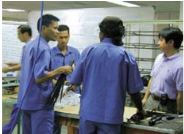
図12 マレーシアでの2次試作

商品コンセプトの作りこみにおける現地での徹底的な品質機能展開の議論をはじめ、本格的な ASEAN 生まれの本プロジェクトを現地に軸足を置きつつ進めるべく、組織をブレークスルーした CE（コンカレントエンジニアリング）特別プロジェクトチームを発足させた。又現地における前線基地として、マレーシアに2年間の暫定期間ながら IT（情報技術）環境にも考慮した活動拠点を設け、3名の駐在員と現地スタッフが、開発と製造の情報共有、原価低減、2次試作実施、部品補完推進、品質作り込み等に努めた（図12、図13）。