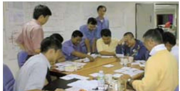
図4 品質機能展開議論