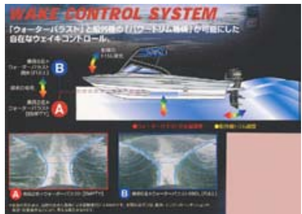
図 3 ウェイクコントロールシステム概念図

これから述べる開発内容は、机上での検討に加え、実機でのプロボーダーを含む社内外のスペシャリストによるプリ評価での徹底的な作り込みを経て、商品化できたものである。以下に説明する 3 つの要素がうまく融合し、ドライバーが意のままに好みのウェイクサイズ、形状をコントロールできるシステムとして機能することになる（図 3）。