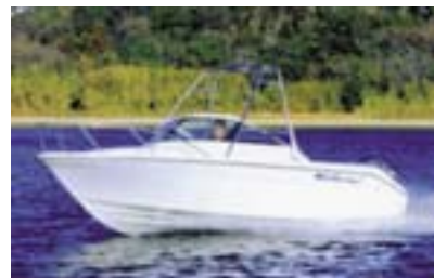
図 4 FR-21

性能の基本となる船型（ハルの形状）は、我々の既存艇の様々な船型ストックの中から、市場でのウェイクボードユースで特に評判の高かった FR21 のものをベースとした（図 4）。この船型を、よりウェイクボードに適したものとすべく、以下の項目に改良を加えた（図 5）。