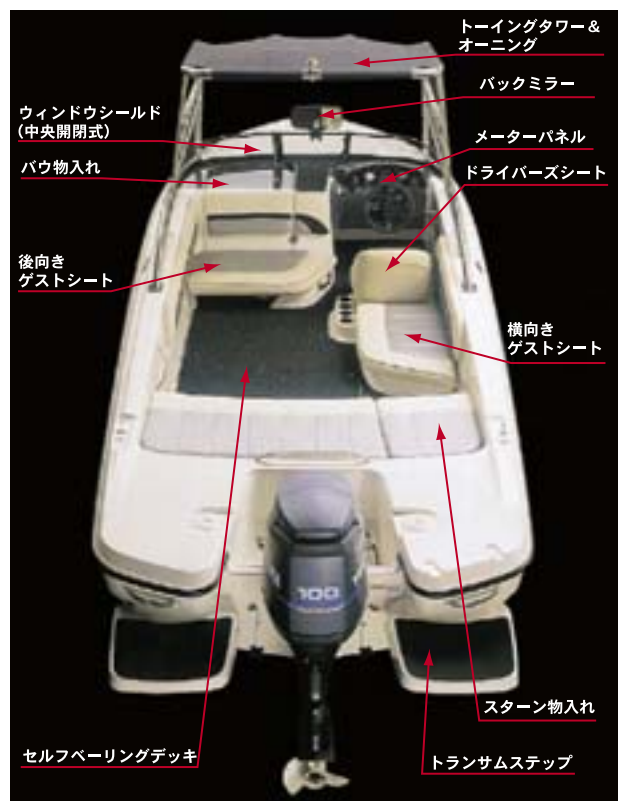
図 8 デッキレイアウト