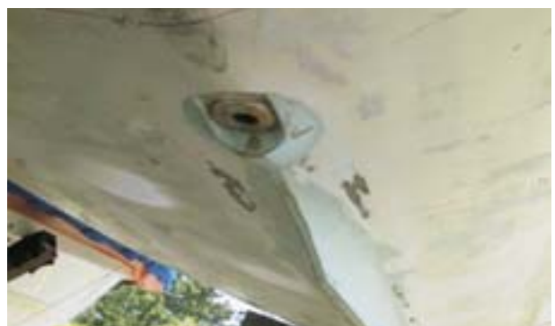
図 7 貫通ピースのリセス形状 (プリ評価での造り込み写真)

機能面は、静止状態でバルブを開くと 8～9 分で満水となる。貫通ピースの船外側周囲は図 7 の