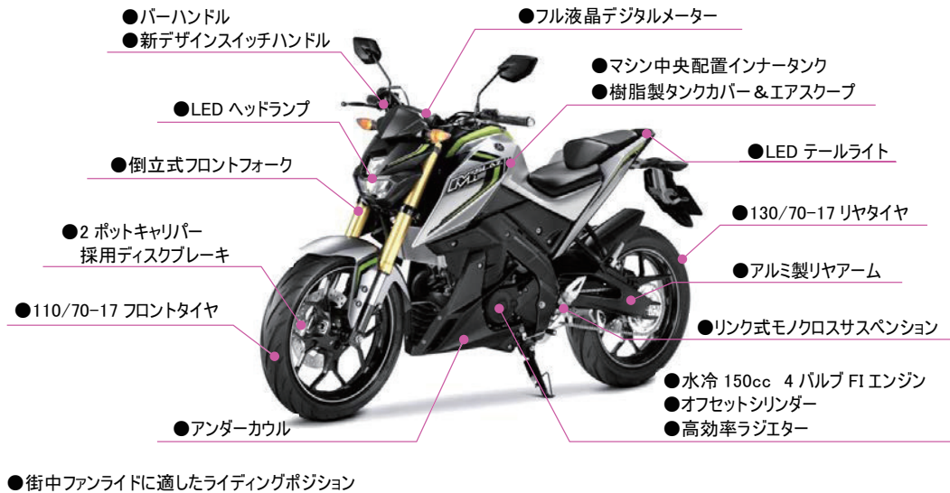
図2 フィーチャーマップ