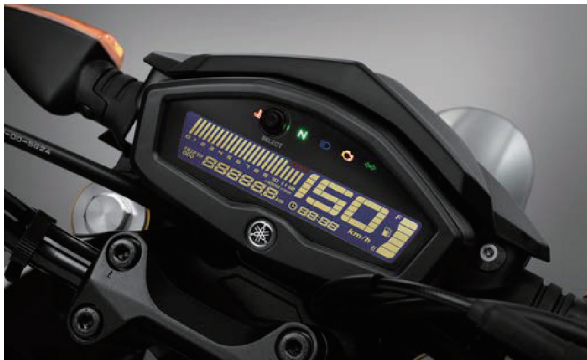
図9 デジタルメーター

小型のフル液晶デジタルメーター（図9）を採用した。左側にエンジン回転数をバー表示し、右側は速度計のレイアウトとした。回転数のバー表示は加速フィーリングを演出する。また、ヘッドランプと同じく軽量・コンパクトであることから、フロントまわりの慣性モーメントが低減でき、軽快なハンドリングにも貢献している。なお、照度は3段階で調整が可能である。