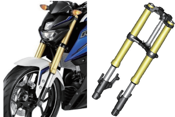
図5 倒立式フロントフォーク

フロントフォーク(図5)は、 37\text{mm} 径インナーチューブの倒立式で機敏な走行性を支え、同時に外観上マッシュ感を印象づける。バネ下重量低減の効果に加え、上・下ブラケット類の剛性最適化などのバランス調整により、クイックなハンドリングと高いフロント接地感の両立を実現した。またフォークオフセット値を 45\text{mm} にするなどフロント回りの各ディメンション調整を行い、車体とのマッチングを図った。ストロークは 130\text{mm} である。