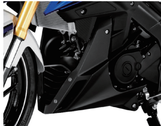
図7 アンダーカウル

走行風を積極的にシリンダー、ヘッド方向へ導くフィンを設けたアンダーカウル（図7）を採用した。これにより空力特性と泥はね抑止効果を向上させた。