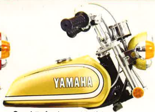
●ハイパークルライトグリーン

★シートも本格派キルティング入り。下部にヘルメットハンガー ★ハイセンスなタンクグラフィック