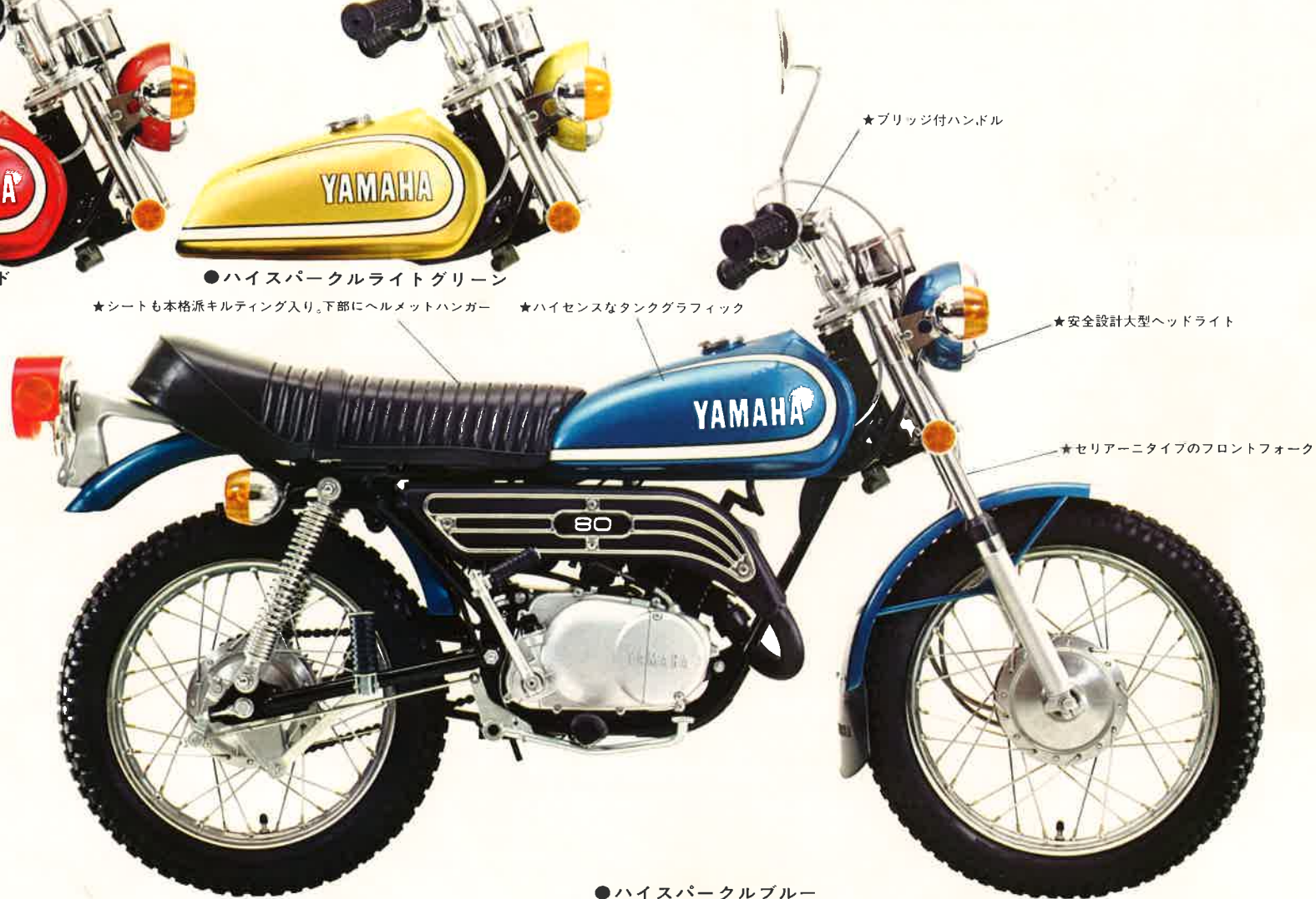
★ブリッジ付ハンドル

★シートも本格派キルティング入り。下部にヘルメットハンガー ★ハイセンスなタンクグラフィック