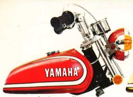
●ハイパークルレッド