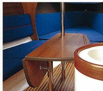
フォールディング・テーブル(折りたたみ状態)