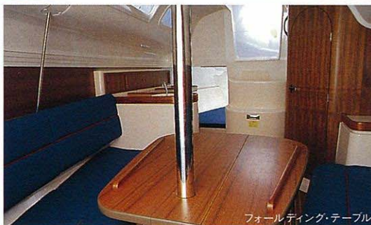
フォールディング・テーブル

クルーの負担を軽減するとともに、その卓越した帆走性能を存分に引き出すための装備を採用しています。ジブセールの収納、風速の変化に対応できるジブファーラー。そして、メインセールの収納をサポートするレージージャックを標準装備して、操作性を高めています。