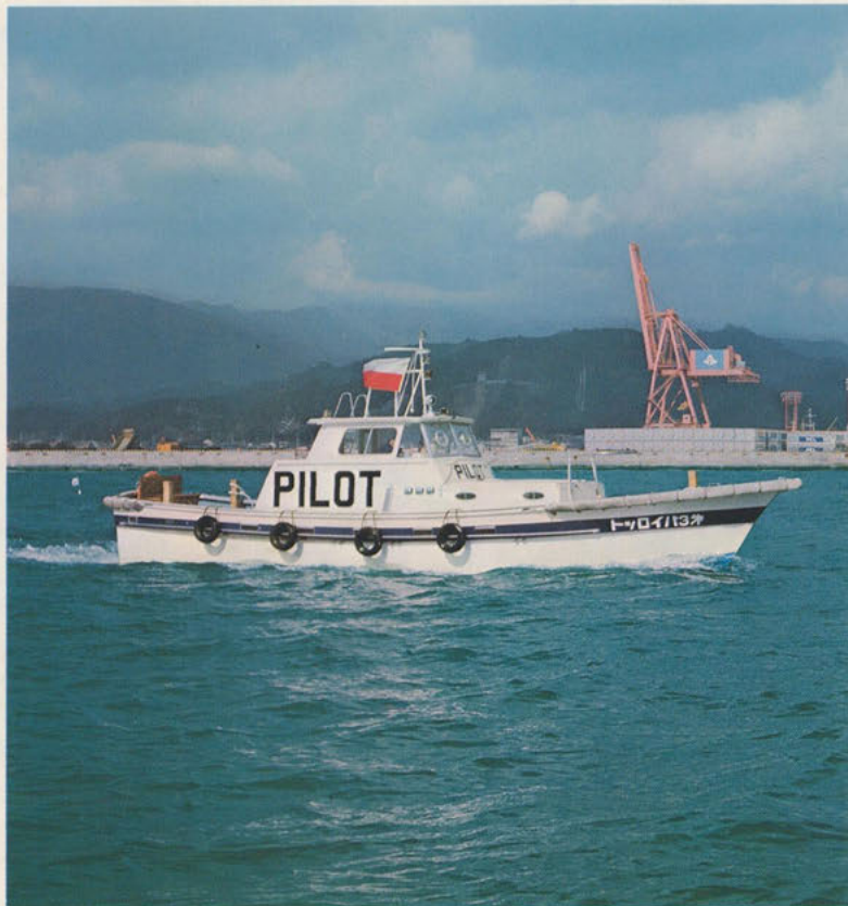
清水水先人会御使用(第3パイロット艇)

支店：北海道(札幌) ☎011(641)2711・仙台 ☎0222(94)6121・東京 ☎03(572)2021-9・青山 ☎03(406)3811-7・名古屋 ☎052(913)2121・東新 ☎052(261)5856・大阪 ☎06(538)7331・広島 ☎0822(82)411111・四国(高松) ☎0878(31)1661・九州(福岡) ☎092(41)3606