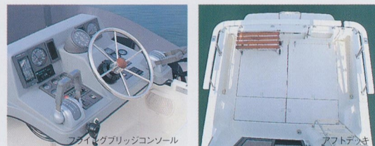
フライングブリッジ

*写真のアフトデッキベンチシート・ナビファイnder・マリンオーディオはオプションです。アウトリガーは任意装備品です。