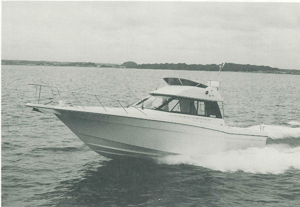
ヤマハ『SF - 31』

ヤマハ発動機株式会社では、スポーツフィッシャーマンの機能と性能を31フィートに凝縮したインボード2基掛けのフライングブリッジ付きミニマムボートとして、4級小型船舶操縦士免許で乗れるニューモデル『SF - 31』を新たに開発しました。本年12月1日より発売を開始いたします。