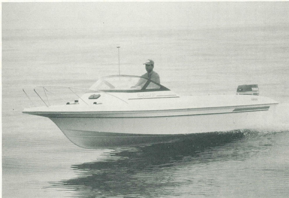
ヤマハ「サンフレンド21」

ヤマハ発動機株式会社では、釣りを主要な使用目的とする多目的モデル『サンフレンド21』（FC-21）を新たに開発しました。購入しやすく乗りやすい初心者向けの性格を持つボートで、'93年9月1日より発売いたします。