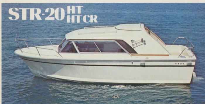
ストライプ20ハードトップ — 海原のステーションワゴン ストライプ20ハードトップクルーザー — 海原を航くサロン

注=ハードトップとハードトップクルーザーは、ハル・デッキまわり・ルーフなど外観上同一ですが内部構造が異なります。