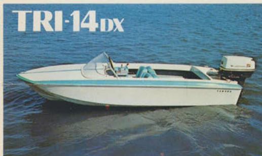
トリマラン14デラックス — ファミリーレジャーの花形