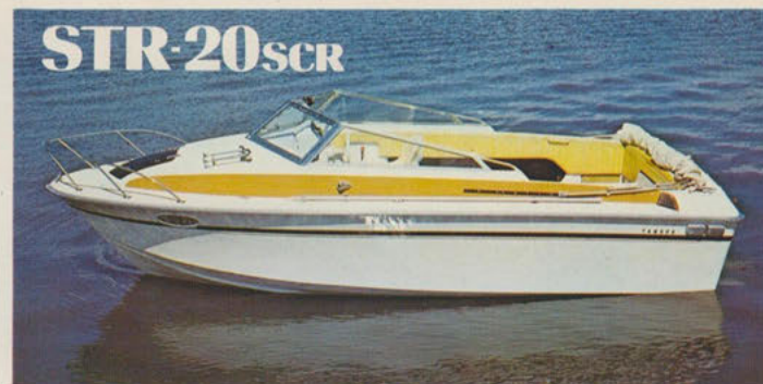
ストライプ20スポーツクルーザー — 優雅に踊るオフショアドルフィン