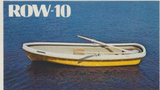
ローボート10 — 手軽に水遊びを