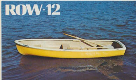
ローボート12 — 水辺の人気もの