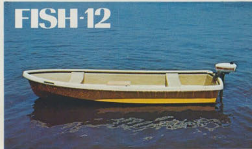
フィッシャーマン12 — 釣りボートの決定版