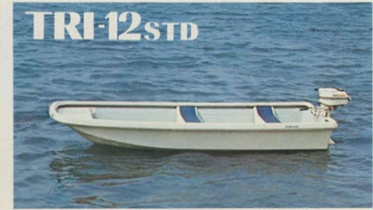
トリマラン12スタンダード — 手軽に楽しむオープンディングー