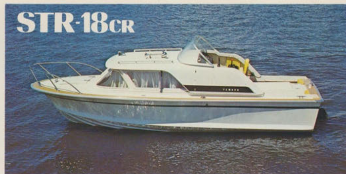
ストライプ18クルーザー — キャビンクルーザーのパイオニア