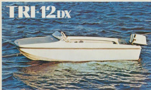
トリマラン12デラックス — マリンレジャーの入門艇