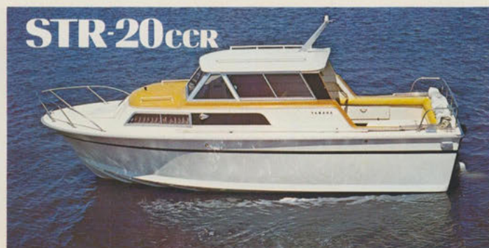
ストライプ20キャビンクルーザー — 海に浮かぶリビングルーム

注=ハードトップとハードトップクルーザーは、ハル・デッキまわり・ルーフなど外観上同一ですが内部構造が異なります。