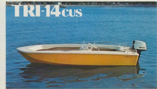
トリマラン14カスタム — マリンスポーツの基地