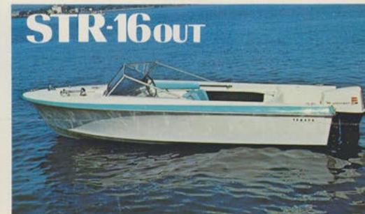
ストライブ16アウトボード — ヴァイタルな男のスポーツボート