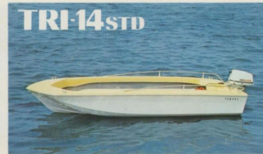
トリマラン14スタンダード — 広い用途の汎用ボート