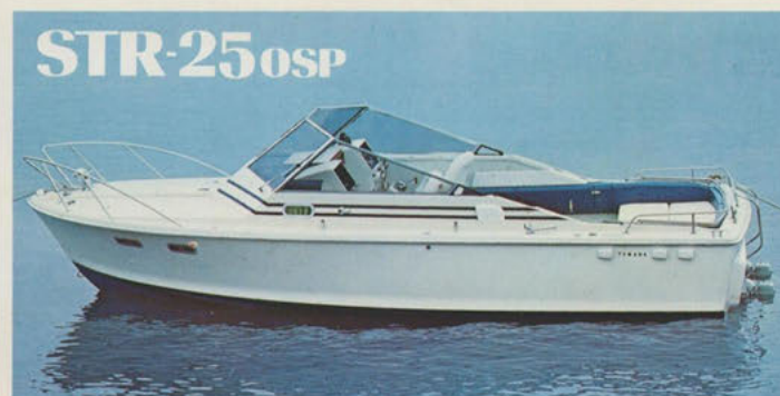
ストライプ25オフショアスポーツ — 走る別荘・ゴージャスなクルーザー