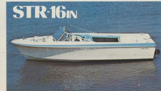
ストライブ16インボード — 海のプレイブランド