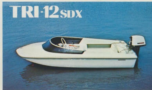
トリマラン12スポーツデラックス — 海のスポーツバギー