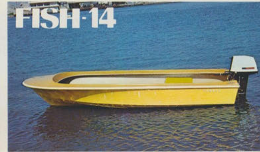
フィッシャーマン14 — イケスもついた本格派