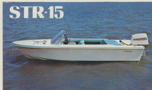
ストライブ15 — 波に挑むアクションボート