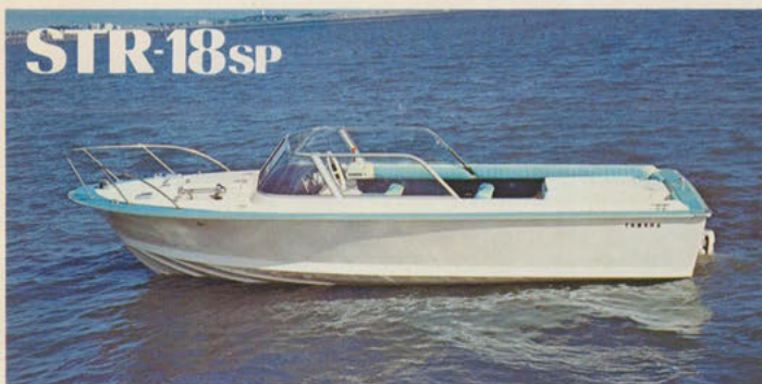
ストライプ18スポーツ — マリンレジャーを拓げるファミリースポーツボート