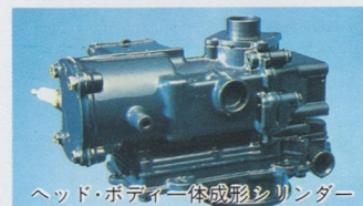
ヘッド・ボディー一体成形シリンダー

シリンダーヘッドとシリンダーボディーを一体成形して構造をシンプル化。ガasketのトラブルによる水洩れや腐蝕が構造上ありませんから、この面でメンテナンスの心配がなく、加えてエンジンの耐久性も一段と向上しています。また非常に軽量で持ち運びや取付けも簡単です。