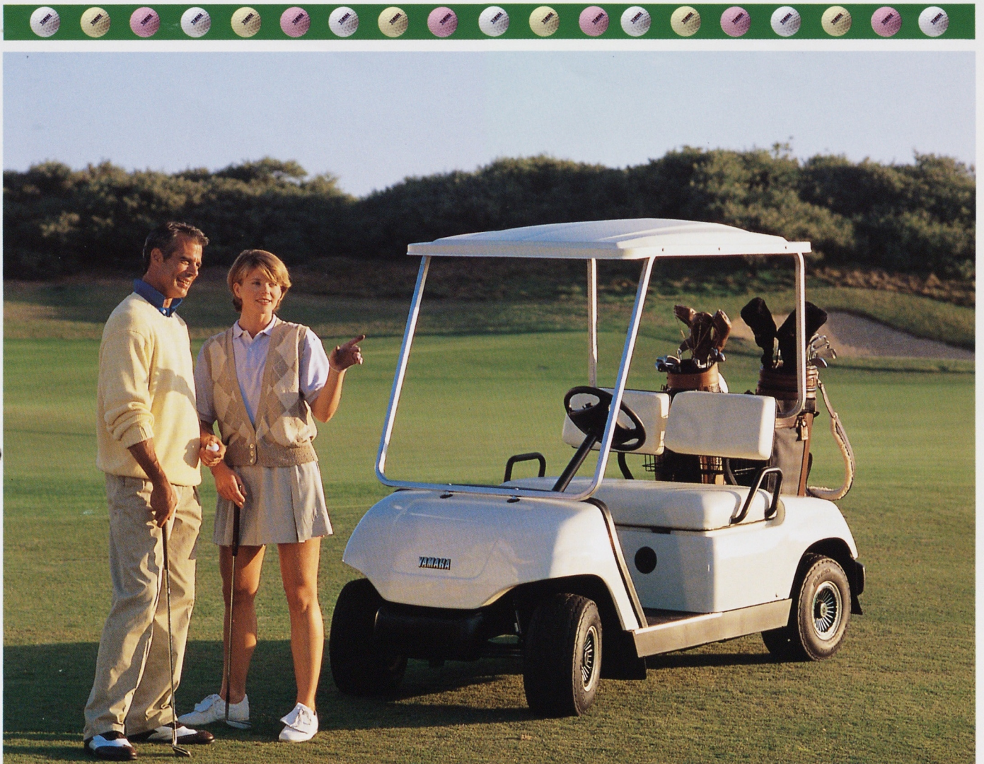
写真はUS仕様 (2バック仕様、サントップのみ装着) です。

そのすぐれた技術力で、常に一步先ゆくゴルファーをお届けしているYAMAHAから、 今また、たのもしい味方「YAMAHA G14-AD」が登場しました。 高品質な外観、強化された耐候性・耐衝撃性、そしてゆとりのパワーと居住性。 高いコストパフォーマンスとともに、ゴルフ場経営に“価値”ある機能を満載しています。