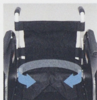
ランバーサポート機能シート