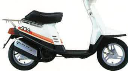
クリーミーホワイト