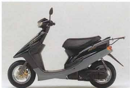
ブラックメタリック2(全車共通)

カラーリング：『Y A50』ブラックメタリック2、コンペティションシルバー 『Y A50D』ブラックメタリック2、ダークグレーイッシュブルーメタリック1、ブリリアントレッド、『Y A90』ブラックメタリック2、コンペティションシルバー、インペリアルブラウン