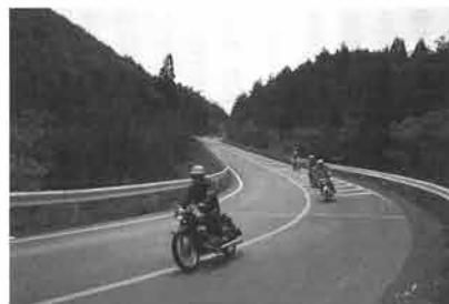
30年を経た今も、製造当時と変わらぬ走りを見せる。先頭はYCI

発表し続けてきました。なかでも、現在のTZRやR1-Zなどに至る、2ストローク、車の系譜は、最もヤマハラしさあふれるシリーズ