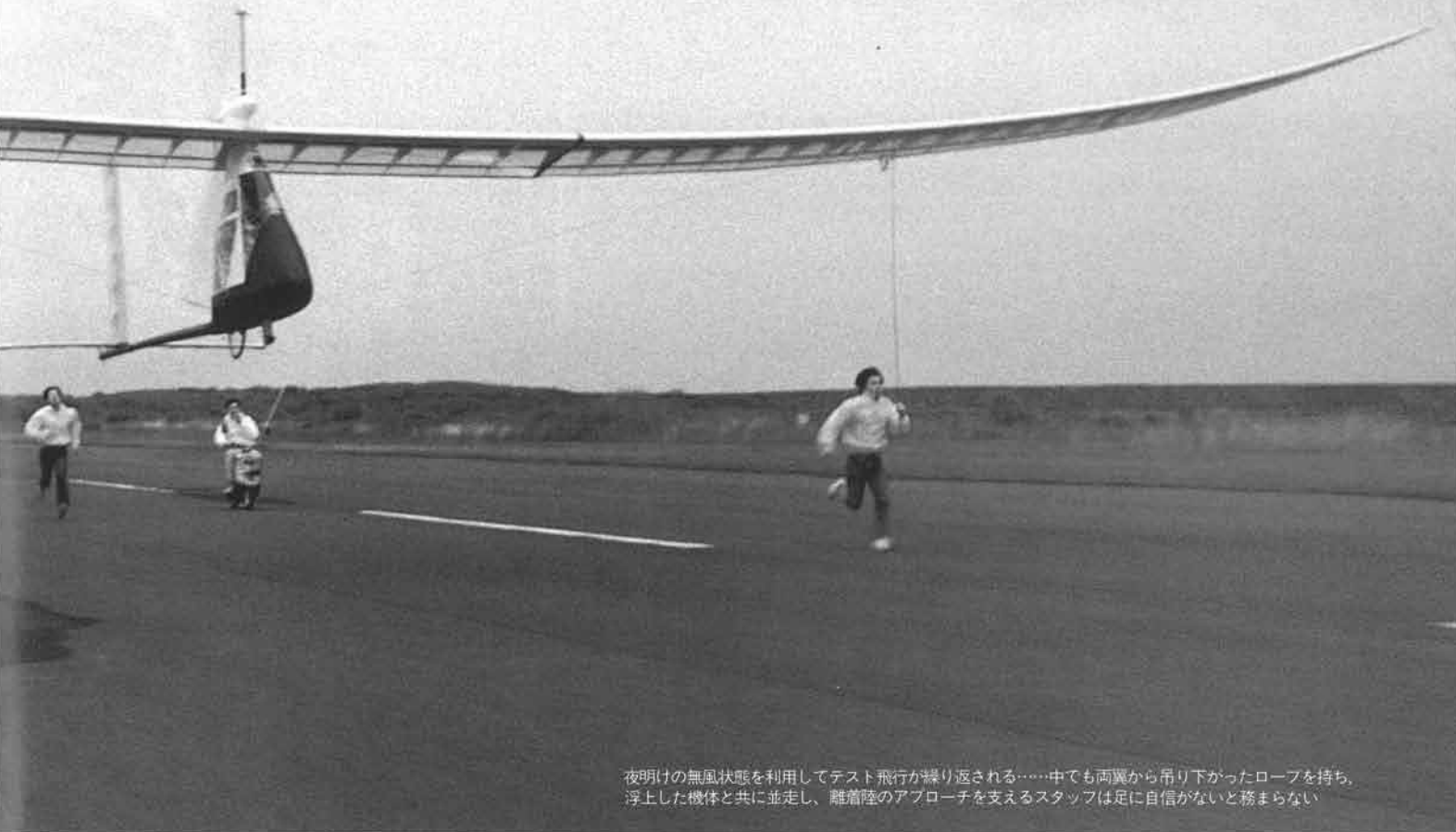
夜明けの無風状態を利用してテスト飛行が繰り返される……中でも両翼から吊り下がったロープを持ち、浮上した機体と共に並走し、離着陸のアプローチを支えるスタッフは足に自信がないと務まらない

もちろん、強度と剛性に優れ、騒音面でも有利になるように作ることでできただけです」