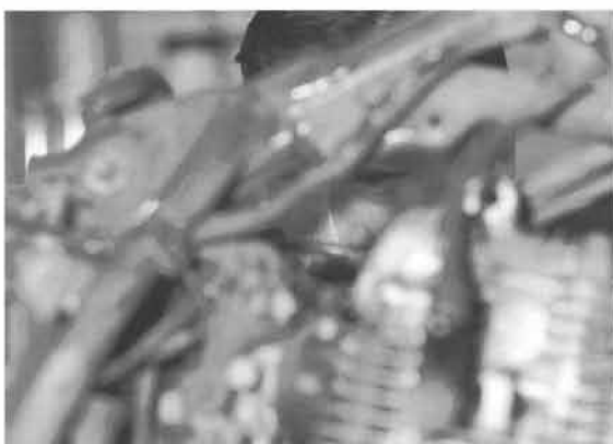
もともとメカ好きの真壁社長。愛車を安心して任せられる頼もしいサービスマン