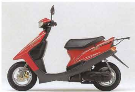
ブリリアントレッド(YA50Dのみ)