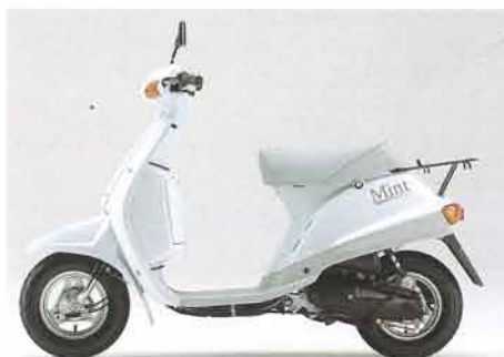
セラミックホワイト