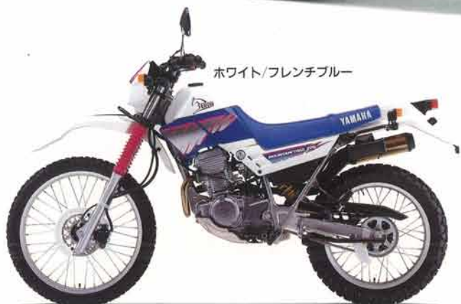
ホワイト/フレンチブルー