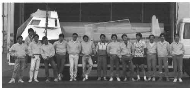
風を捕まえたヤマハ鳥人間達の夢は「琵琶湖の対岸に着陸すること」という