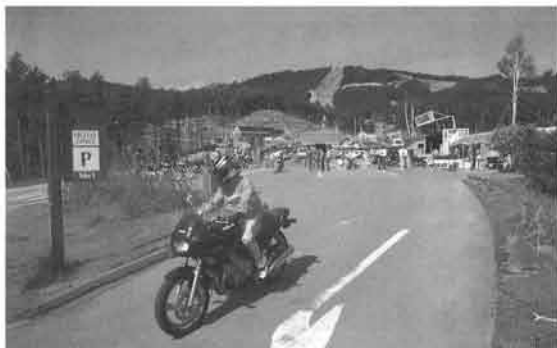
好天に恵まれたプレス試乗会では、ディバージョンの魅力が100%引き出された

そうしたヤマハの意図を、各マスコミ媒体の方たちを通して広く理解していただくために、ヤマハでは6月10日、11日の2日間、29誌紙80名のプレス関係者を招いて試乗会を行いました。舞台となったのは、スキーリゾートとしても有名な長野県・小海R.E.E X。八ヶ岳公園道路をはじめ、快適な走行感覚をたっぶり味わえるロケーションの中で、「風、旅、美」の思想をじっくりと体感したみなさんは、試乗後口をそろえてディバージョンを絶賛、「ツーリングの良さを誘う」「この価格でこのデキの良さは信じられない」と