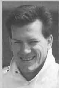
ダグ・チャンドラー