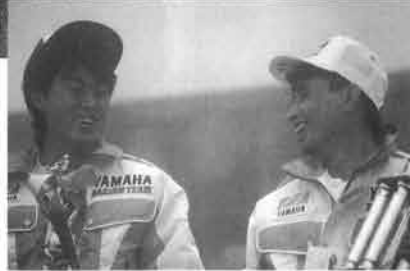
ランキング上位を占めるヤマハの2人。第4戦以降が楽しめた。