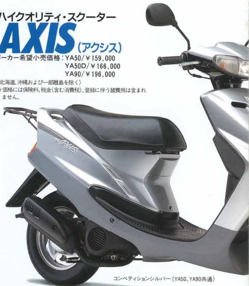
コンペティションシルバー (YA50、YA90共通)