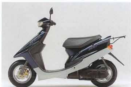
ダークグレーイッシュブルーメタリック1(YA50Dのみ)