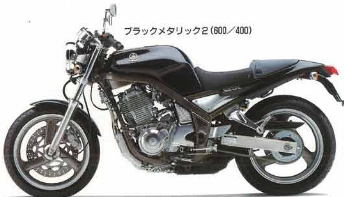
ブラックメタリック2 (600/400)