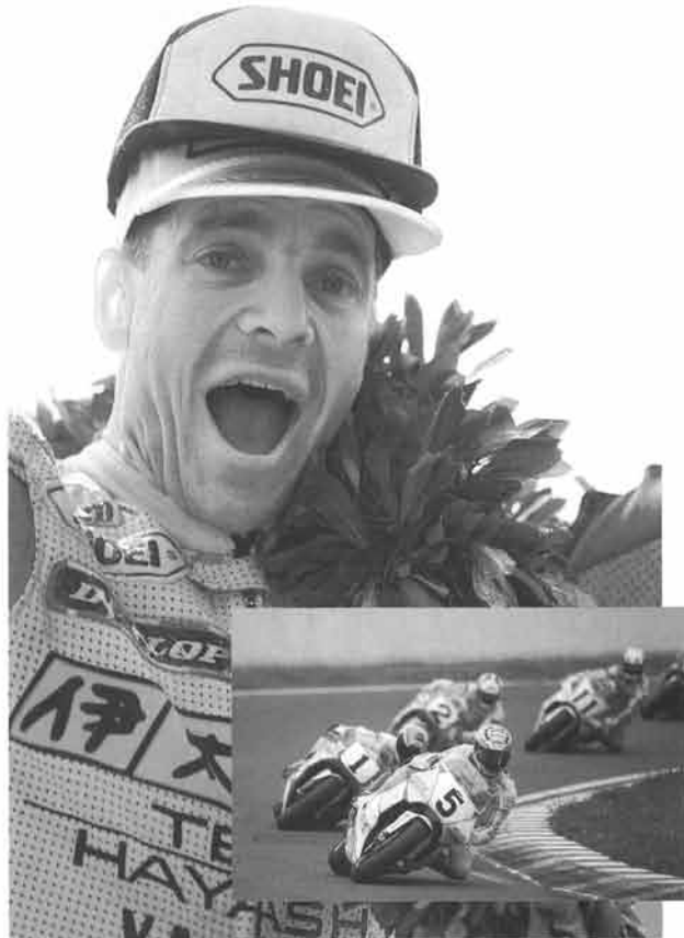
気の抜けない激しいバトルを制しただけに、ゴタードの喜びもひとしお