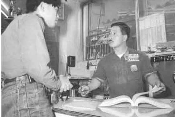
部品注文で来店したお客さまに対し、必要な工具、作業の方法まで詳しく説明する。「ダメだったら遠慮しないでTELしなよ」とつけ加える