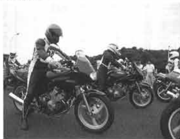
セールス勉強会では、セールスポイントを自らの実感としてとらえようと、全員が真剣そのもの

いう声があちこちで聞かれました(評價の内容は10ページ)。 また、この試乗会に先だって、セールスする側もしっかり商品知識を身につけておこうと、全国の営業所からYESSリーダーやSPリーダー、サービスマン107名が集まり勉強会を開催。本社で商品、技術説明を受けた後、袋井のヤマハコースで試乗会に参加するなど熱心に取り組み、販売店のみなさんに、ここで身につけたすべてを余すことなく伝えて、一緒に大きく拡販していきたくと意欲を見せていました。