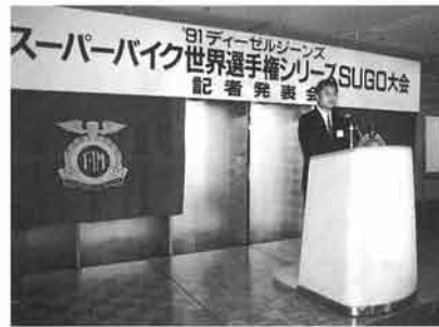
記者会見ではスポーツランドSUGGOの新社長があいさつ

その大会記者会見が、5月30日、東京・飯田橋で開かれ、8月24日、25日の2日間、宮城県・スポーツランドSUGGOで91シリーズ第8戦として開催すると正式発表されました。