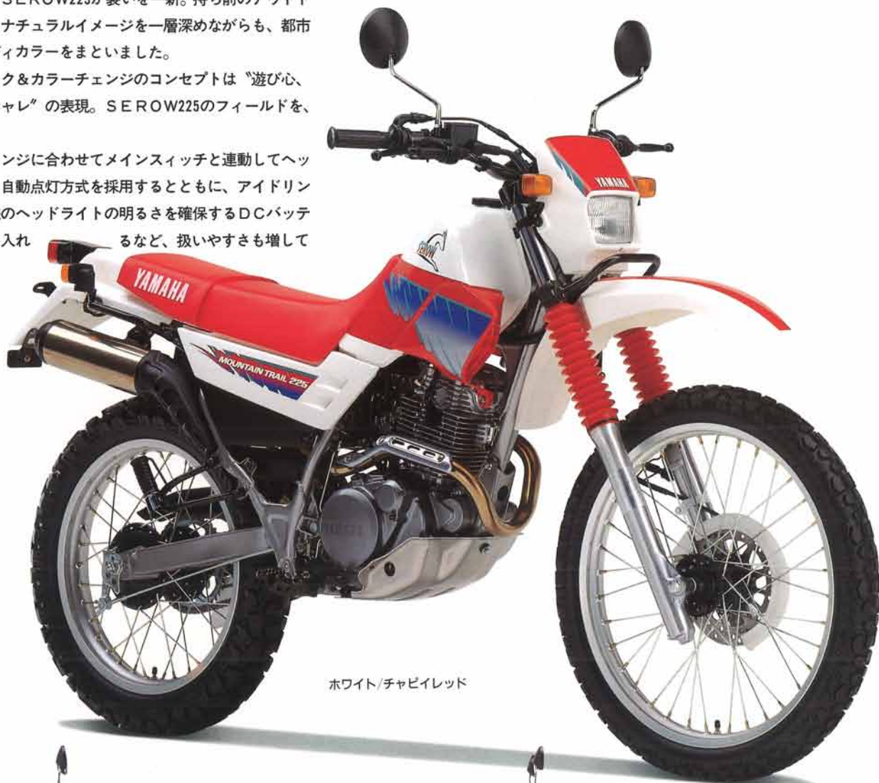
ホワイト/チャビイレッド

また、カラーチェンジに合わせてメインスイッチと連動してヘッドライトが点灯する自動点灯方式を採用するとともに、アイドリング時も走行時と同様のヘッドライトの明るさを確保するDCバッテリー点灯方式を取り入れるなど、扱いやすさも増えています。