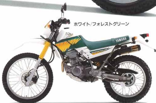
ホワイト/フォレストグリーン