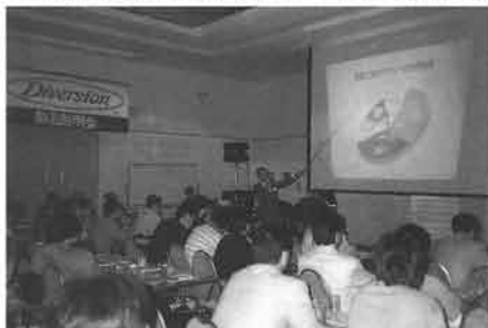
「風、旅、美」のコンセプトは、プレス関係者の間にしっかり浸透