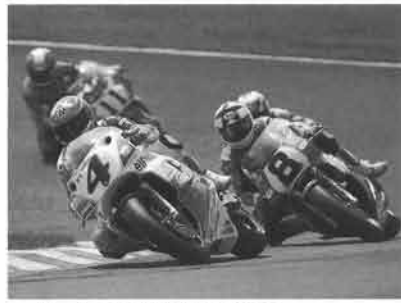
テールtoノーズの接戦が随所でみられる

今、最もホットで激しいコンペティティブなレースを展開し、世界中のレースファンの人気を集めているスーパーバイク世界選手権が、今年も『91デューセルシリーズ スーパーバイク世界選手権 SUGGO大会』として日本にやってきます。