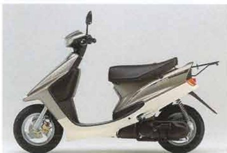
インペリアルブラウン(YA90のみ)