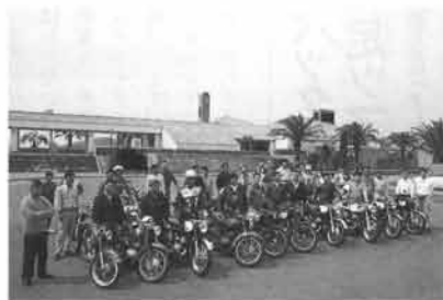
ズラリと並べられた名車たち。すべて、会員の手で愛情を込めてレストアされたものばかり

55年、初めてヤマハがYAAIを世に送り出して以来、今年で36年。この間ヤマハは、それぞれの時代を象徴する多くのエポックメイキングな名車を