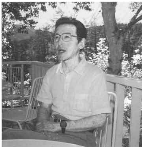
〔ペンション夢風船〕 長野県小県郡長門町姫木平3518 ☎0268(69)2701

は宿泊料金のなかでは質を満たすことはできません。それなら私としては華やかさよりも質や量を重視したいと考えています。見た目より、おいしいものをおなかいっぱい満喫していただきたいですね」