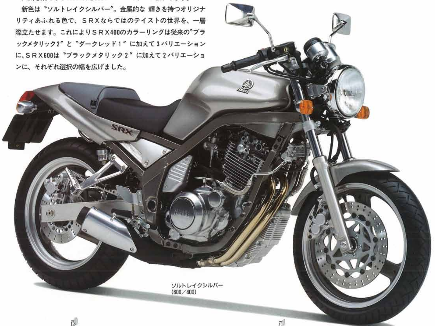
ソルトレイクシルバー (600/400)

新色は「ソルトレイクシルバー」。金属的な輝きを持つオリジナル色で、SRXならではのテイストの世界を、一層際立たせます。これによりSRX400のカラーリングは従来の「ブラックメタリック2」と「ダークレッド1」に加えて3バリエーションに、SRX600は「ブラックメタリック2」に加えて2バリエーションに、それぞれ選択の幅を広げました。