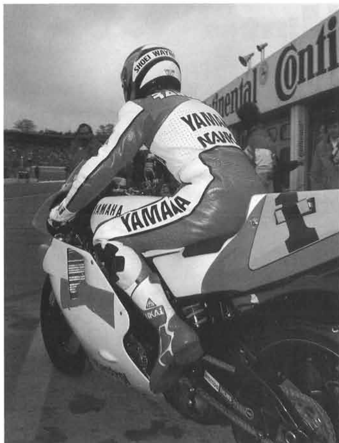
第8戦・ハラマでは独走の3勝目をゲット

第2戦、第3戦と連勝して以来、勝ちを逃がしているレイニー。ランキングもトップドゥーハンに15ポイントの遅れをとっている。今シーズンは有効ポイント制で、全15戦中、高ポイントを獲得した13戦分のポイントでランキングが争われるので実質的な差は多くない。レイニーにはとどこほしがあるだけに不利だが、逆転は充分可能な位置だ。