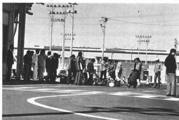
各記者の注目を集めてコースに出るニューカート

スリルが得られる割に安全性が高い等があげられますが、今回発表の「RC 100 J」はとくに低価格で誰にでも容易にカーティングが楽しめる入門車として開発されたものだけに、カートの普及に対するヤマハの意欲が感じられ、各関係者からも今後の活躍に期待が寄せられていました。 午後からの試乗会は、場所を本社向側のテクニカルセンター警田に移して行なわれましたが、地面を這って疾走する個性あふれた走行に、試乗した各社テストライダーも一様に満足な表情を見せていました。