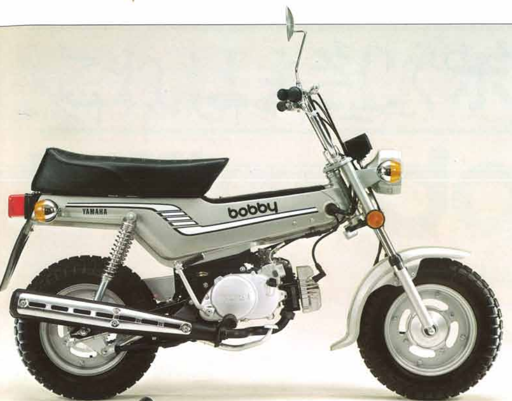
LB50III・H ロイヤルシルバー