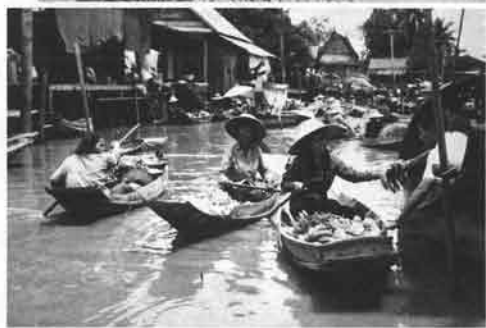
(上)チェンマイの特産品として知られる色鮮やかな日傘を売る女性。 (下)バナナ、パイナップル、マンゴー、そのほか珍しい果物がいっぱい並ぶ水上マーケット。