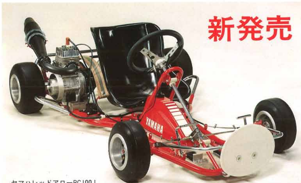
ヤマハレッドアローRC100J