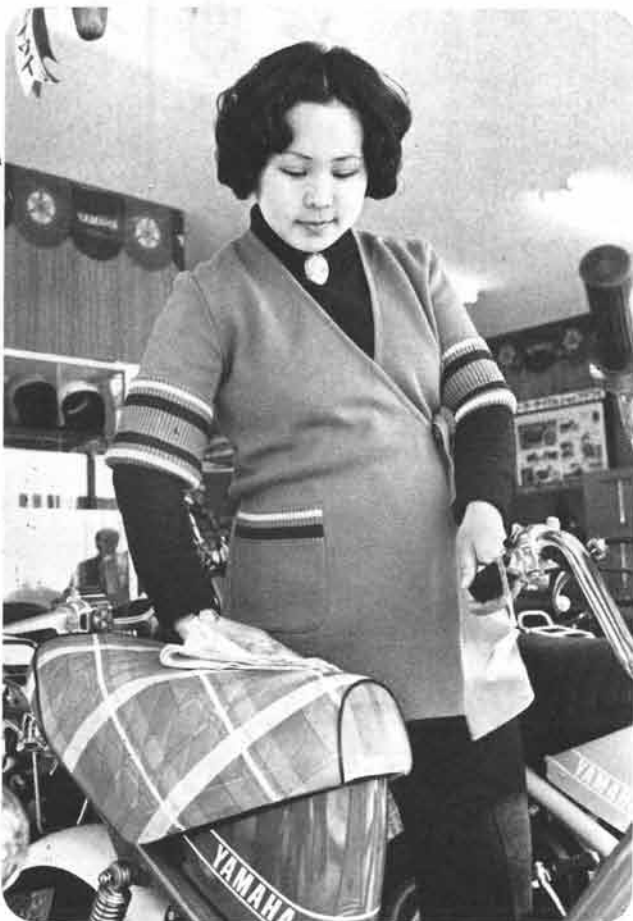
おなかの赤ちゃんに気をつかいながら……