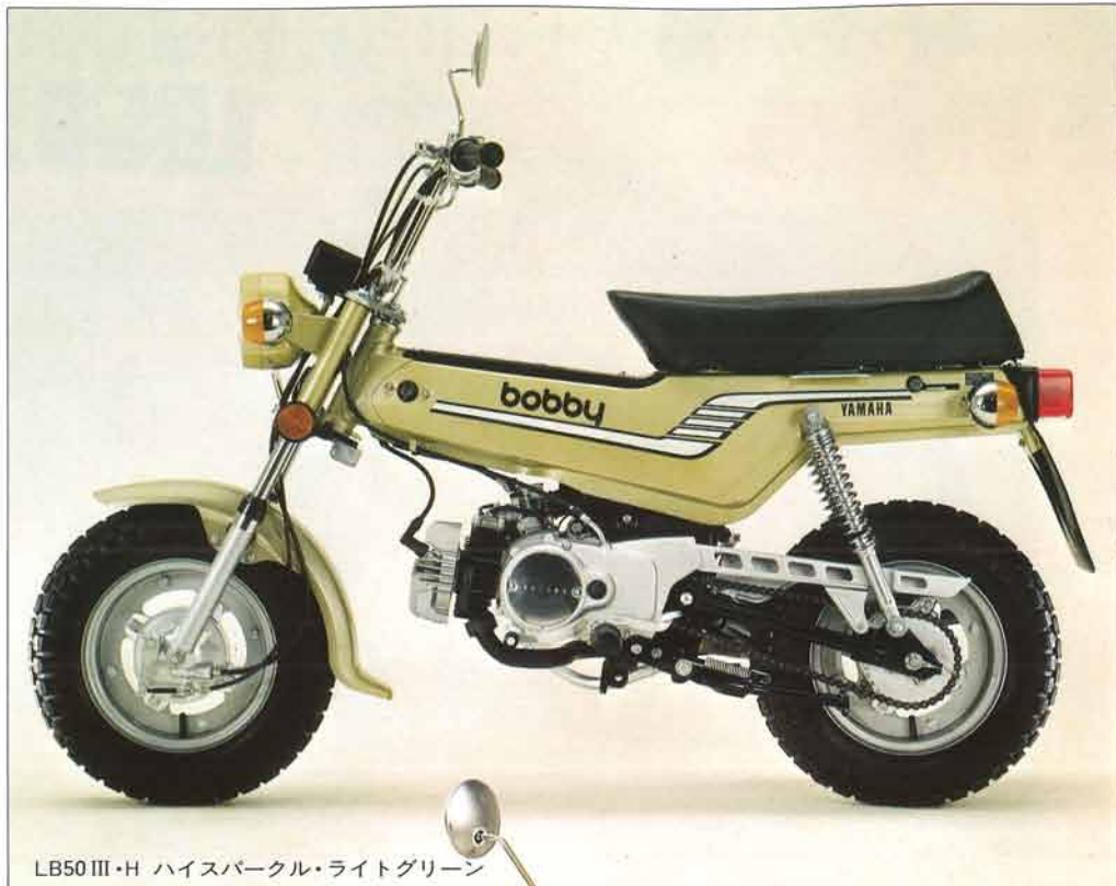
LB50 III・H ハイスパークル・ライトグリーン

ワイドな小径タイヤは、前後とも同一のブロックパターン。フロントフォークも本格的なセリアーニタイプ。