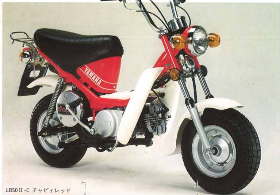
LB50II・C チャピイレッド