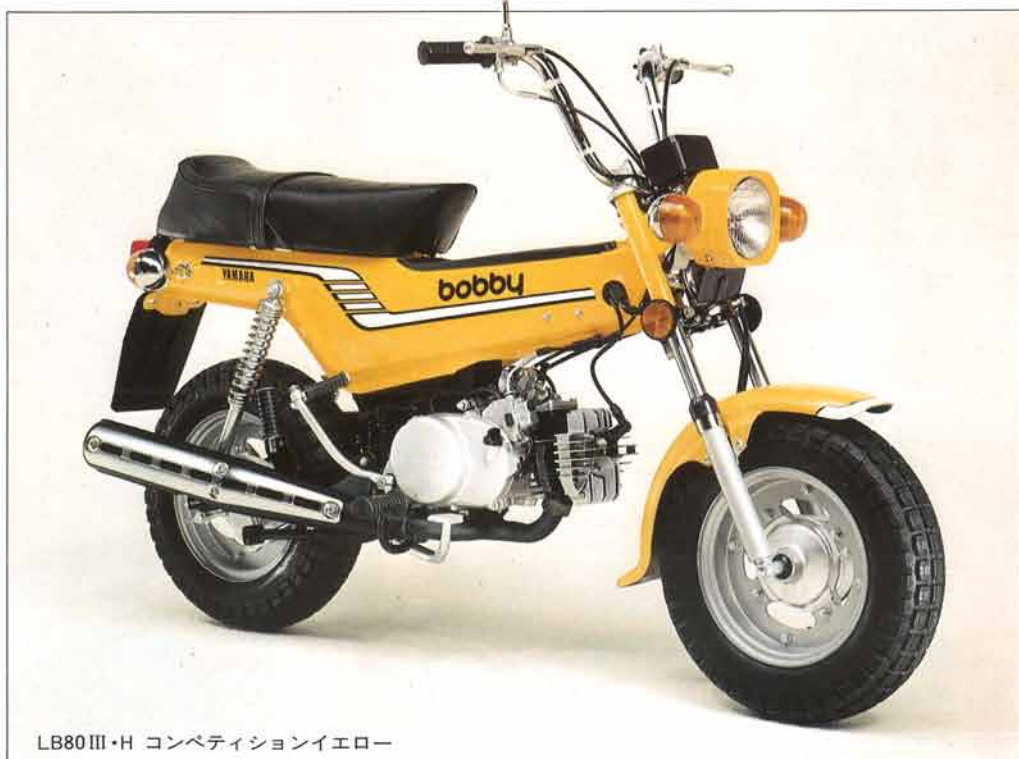
LB80 III・H コンペティションイエロー