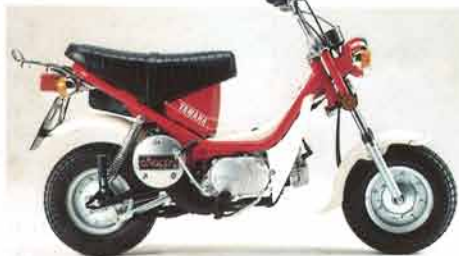
LB80II・C チャピイレッド/リザーブグリーン