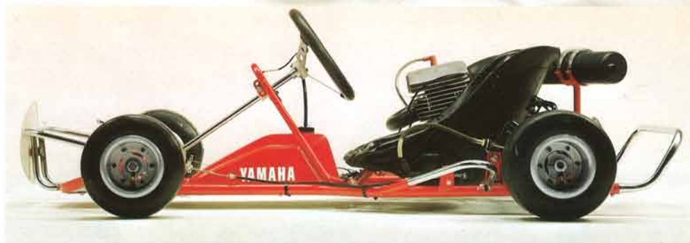
ヤマハレッドアローRC100S