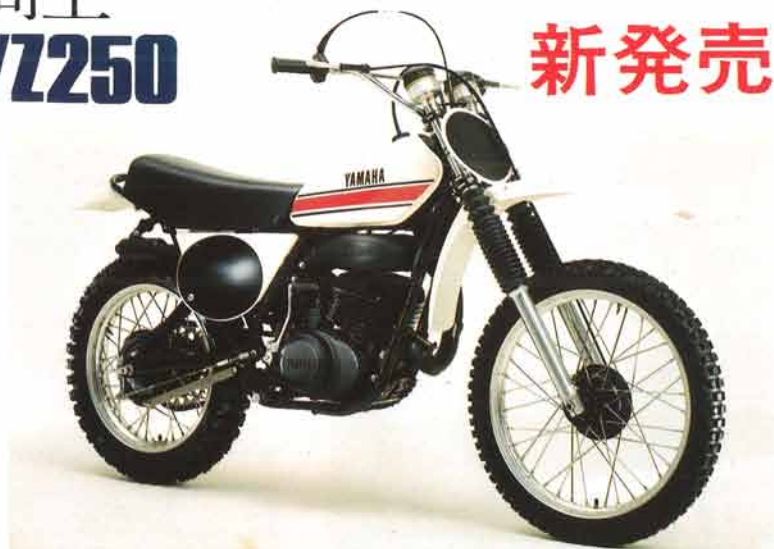
ヤマハモトクロスサーYZ250