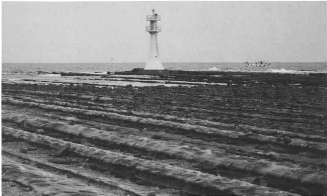
日南海岸、鬼の洗濯板