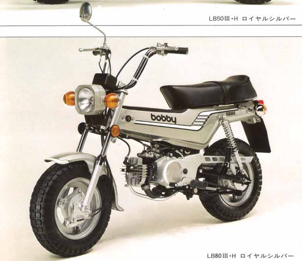
LB80III・H ロイヤルシルバー

これまでのバイクの概念をガラリと変えて、世代をこえて暮しのエリアを広げるヤマハボビイ。ユニークなスタイル、軽快な走り、手軽なとりまわし、そして高い安全性……機構面でのセールスポイントも豊富です。