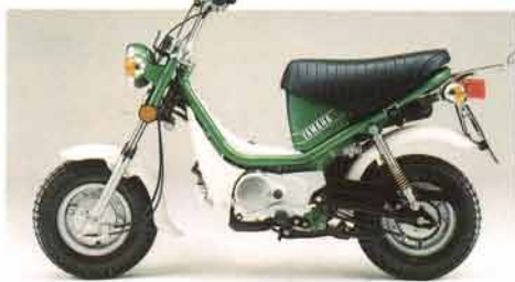
LB50II・C リザーブグリーン

かわいさと爽やかさで女性のお客さまをふやすヤマハチャピイに、新しく「自動遠心クラッチ付き」の「LB50II・C/LB80II・C」が加わり、チャピイが3タイプになりました。