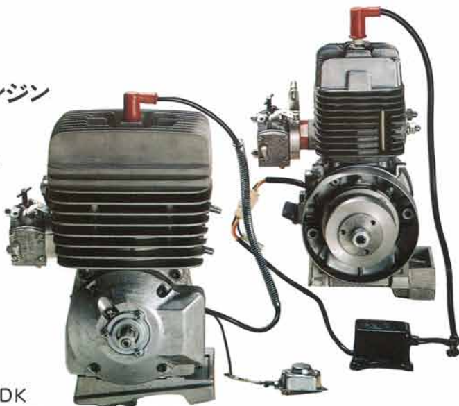
▶エンジン2タイプ、左はKT100S、右はMT100DK

※1976年からSLカートレース、全日本等においてスペアエンジンの使用が認められるようになりました。