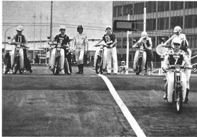
自動車学校とのタイアップによる「乗り方教室」