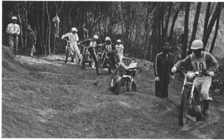
ストラクターが指導にあたり、トライアルテクニックの教授が行なわれましたが、最初はぎこちない動きを見せていた16名の隊員達も、そこは日頃から重量車をこなすモサ連だけあってメキメキ上達、最後の模擬競技では目を

見張るライディングぶりを披露していました。講習内容は、一日目がタイトコーナーの回り方、急登坂・下坂、逆バンク走行、ロック走行、ステアケース、ステイープヒル等の基礎テクニックの指導、二日目が各セクション上での指導および競技が行なわれましたが、隊員達の中には白バイ全国大会に闘志を燃やす人や、トライアラを所有しトライアル九州選手権大会に出場する人もいて、それぞれモータースポーツを思う存分楽しんでいました。