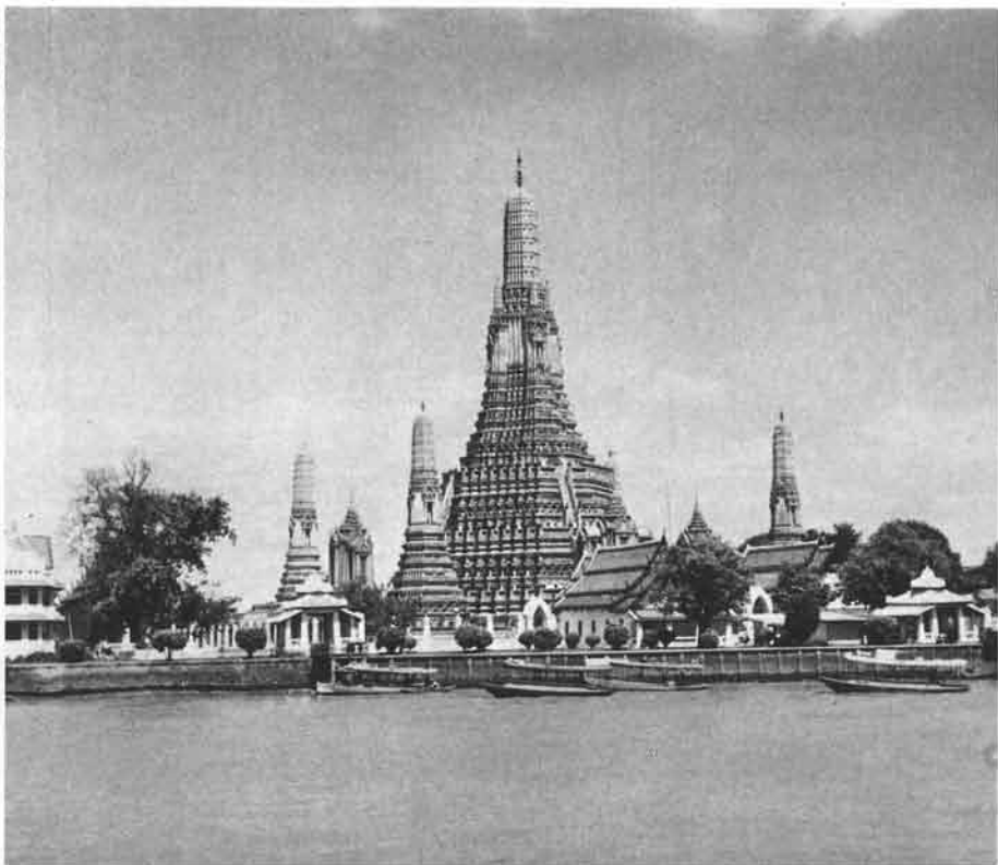
色彩豊かな建築美を見せるワット・アルン（暁の寺）

国民の94パーセントが仏教徒といわれるタイは、ビルマと並んで東南アジア諸国の中でも、最も熱心な仏教国です。男子は生涯に一度は仏門に入って修業しなければならないとさえいわれ、タイの国教として深く信仰されています。第二次世界大戦後、それまでシヤムと呼ばれていたこの国は、タイ国(Thai Land)と正式に改称されましたが、タイ語ではムアン・タイ、すなわち「自由な人々の国」という素晴らしい意味をもっています。