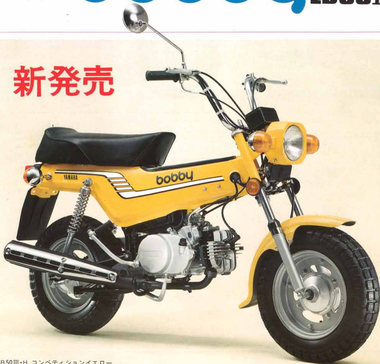
LB50Ⅲ・H コンペティションイエロー

トップグラビアでご紹介のとおり、豊かな市場性を背景に3月1日を期して新発売となるヤマハポビィLB50Ⅲ・H、そして3月下旬発売のLB80Ⅲ・H。ともにバイクの機動性と実用性を最高度にマッチングさせて、『バイクでニューライフ』のリーダー役をつとめる新商品です。