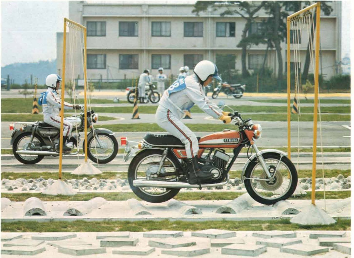
▲インストラクターの訓練は厳しい。あらゆる路面、あらゆる天候のもとで安全に走る技術をわきまえておかななくてはならない。