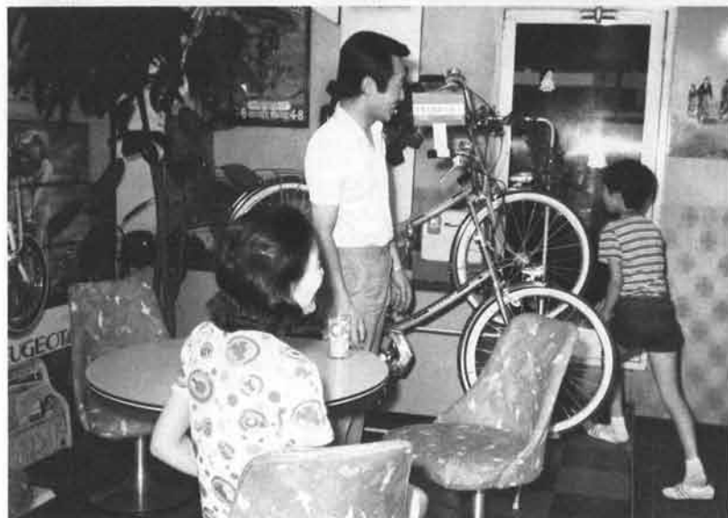
子供さんの目を引くブジョーミニ。