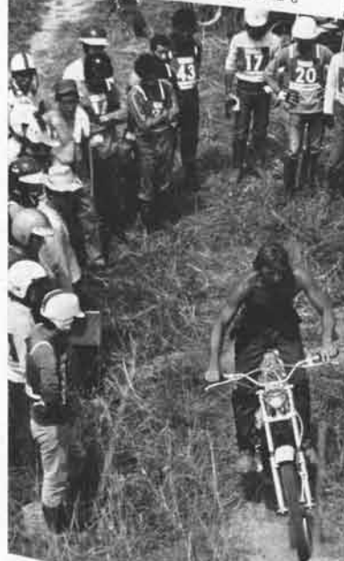
長い急坂を登る。登るにしがたって