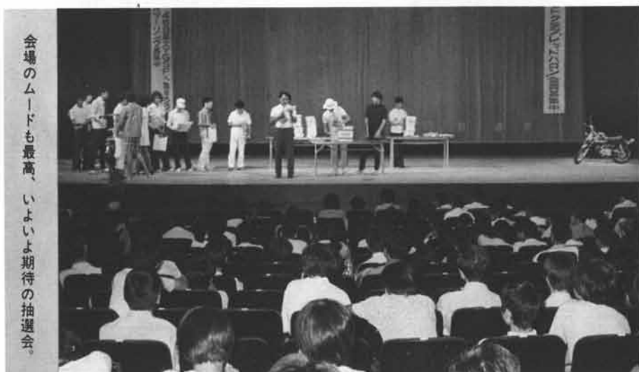
会場のムードも最高、いよいよ期待の抽選会。