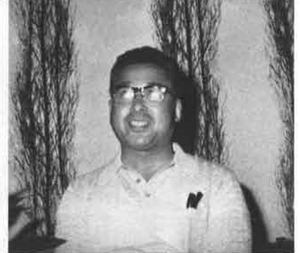
▲鎌倉交通安全協会の浅場会長