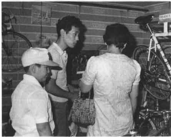
折りから夏休み、お子さまづれのお客さまがひきもきらさず訪れる。