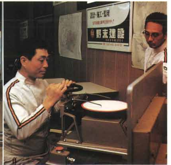
▲安全運転の指導員にふさわしい素質を持っているかどうか、性格テストでチェック。