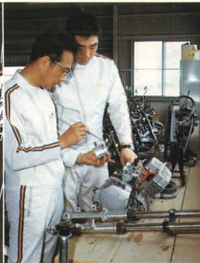
▲二輪車の構造についてのゆきとどいた知識と技術を身につける。