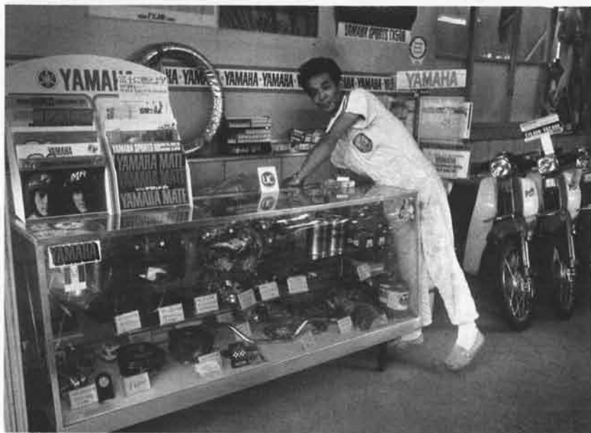
GYTパーツやカタログなどがならんだ支店のショーケース