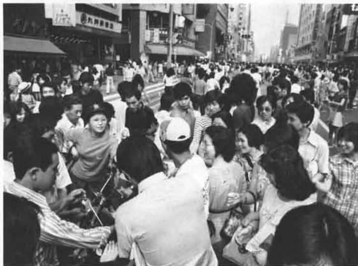
そのうち、オヤッ、あれっ、ということで人の輪が二重、三重とかさなって……