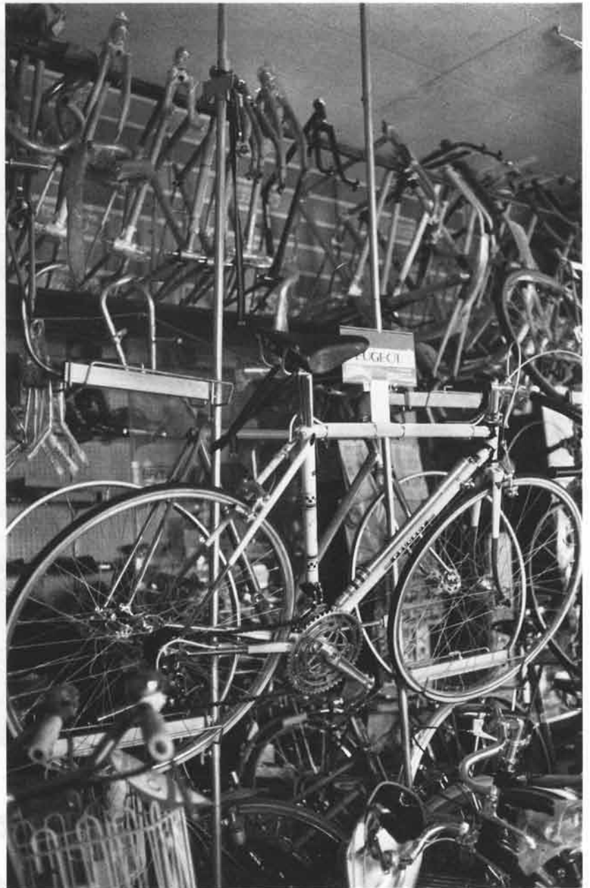
天井近くの壁面までフルに使ったショールーム。来春にはここが倍の面積になる。