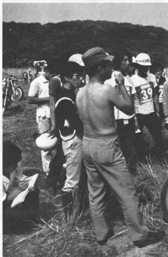
ミックじきじきの、こごぞという重要なポイントの解説に耳をかたむける面々

に駆けつけ、チャンピオンの妙技をつぶさにカメラにおさめたほか、ミック自身も、この教室の意義に大賛同で、トレールランド星野を舞台として行なわれた九州四国地区の教室では、もっとも変化に富んだセクションが得られるところとして、時間を過ぎるのも忘れてデモンストレーションをつづけるなど、参加者に深くトライアルの楽しさ、有益さを示したものだ。 (写真は横須賀・衣笠で行なわれた関東地区の教室)