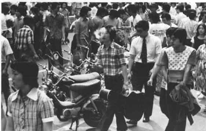
ずらり並んだチャビィ。はじめは通りすぎる人もチラッ、チラッでしたが……