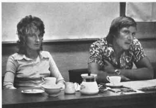
記者会見におけるミック夫妻

これからトライアルをはじめようとする人へのアドバイスとしては、まずトライアルがどんなものであるか、をよく知ってもらいたい。トライアルはスピードを争うものではなく、運転技術を競うものである。けっして危険なものではない。むしろトライアルできたえられれば、それはベストライダーとして安全運転に固り知れない技術がもてるのだ。初心者に対してのアドバイスとしては、まずトライアル・マシンを買ってもらいたい。