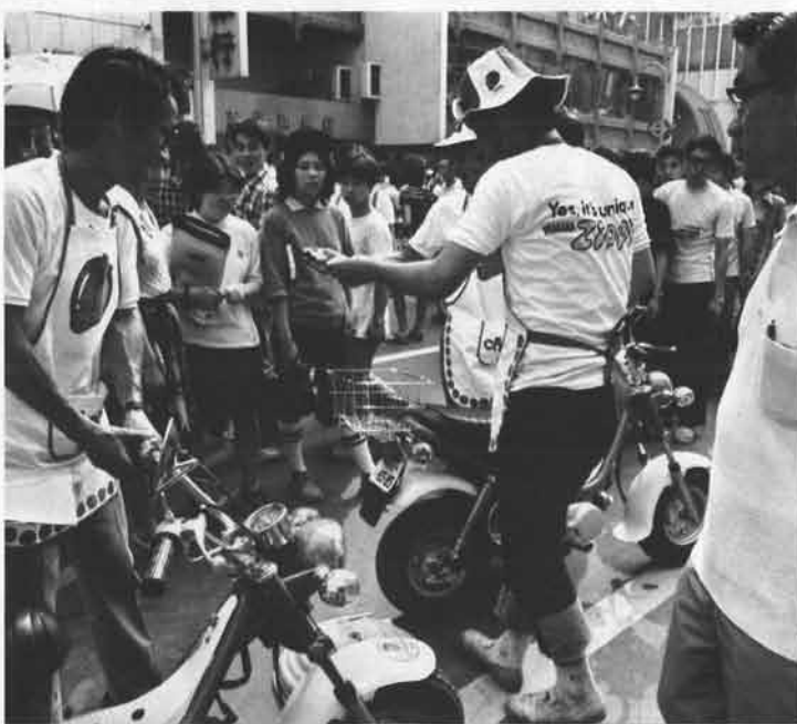
いよいよ本格的なPRキャンペーンの開始となりました