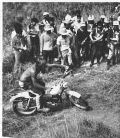
急ターンして斜面を駆けあがる。