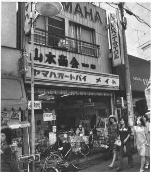
いつも人通りの多い小町通りの本店