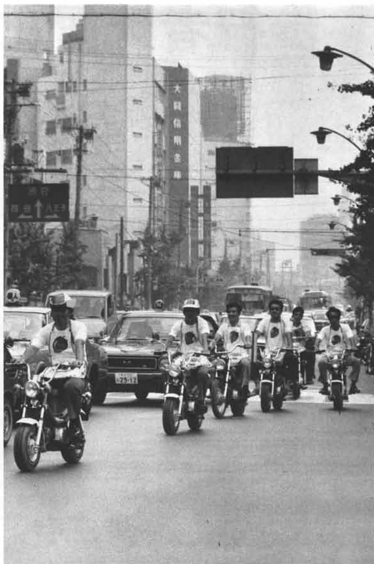
一連のチャビィは静かな排気音を合奏させてまずは歩行者天国の周辺を2度3度と回わる