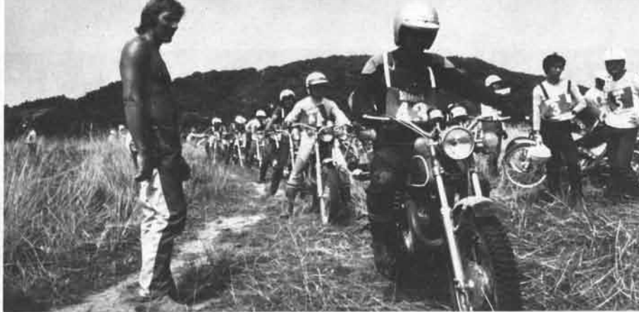
一人ずつ順序よくトライ開始