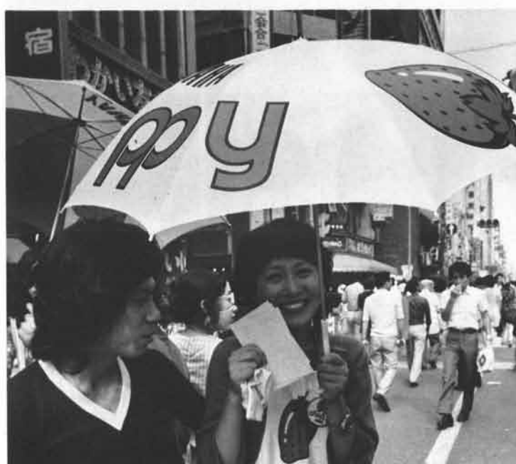
ワァー、パラソルもらっちゃった。大喜びの若いカップル