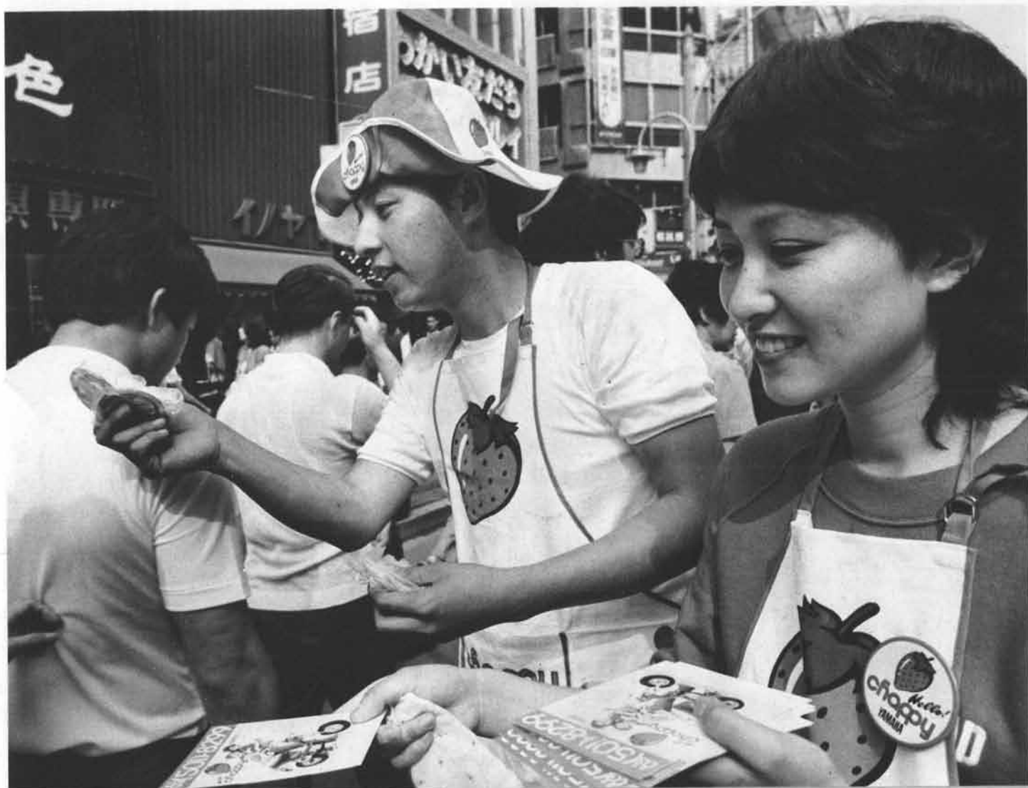
赤いイチゴが目印、こちら、赤くて・小さくて・かわいい“チャビィ”です。パッチをどうぞ！ テレフォンデイトをどうぞ……