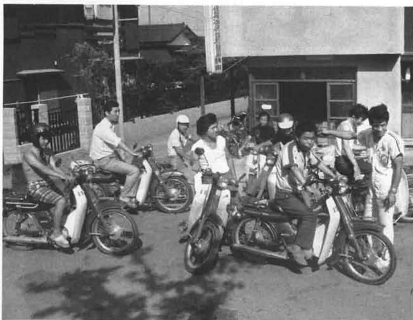
大のお得意さん岩崎新聞店にあいさつまわり