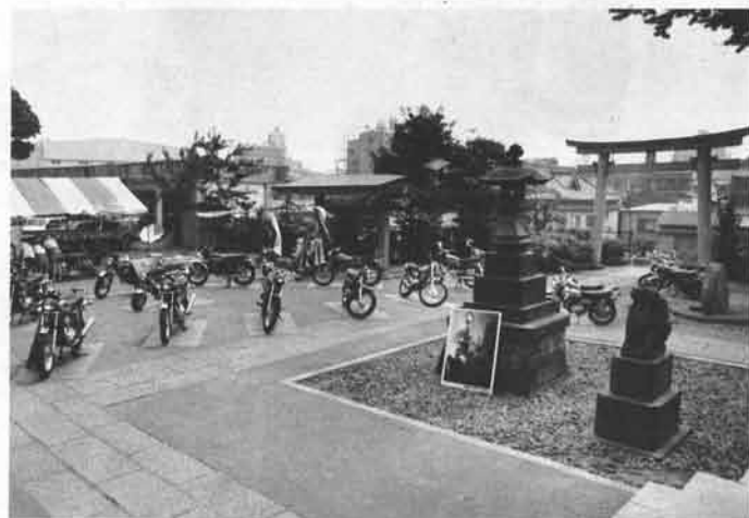
こちらはベースとなった新宿西口公園わきの熊野神社境内の展示場。ここでは土曜、日曜と、2度、3度とチャビィスクールを開催したほか、ヤマハオートバイの総合PRを徹底して好評を博した。これは朝の店開きまえ