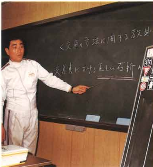
▲学科教室では、どう教えたら、受講生によく理解してもらえるかをつねに研究する。