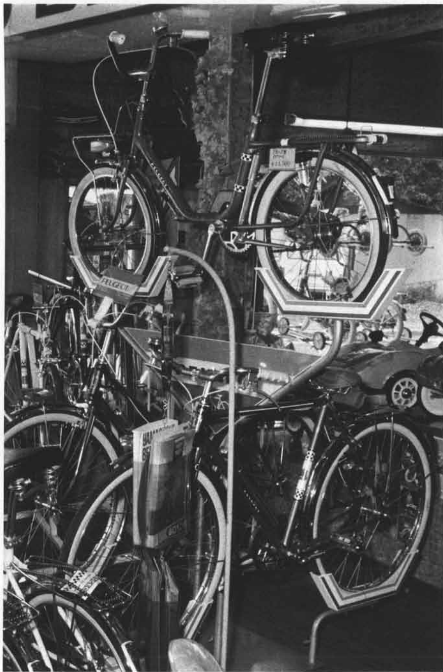
入口の近くに配置されたブジョーサイクル・コーナー。