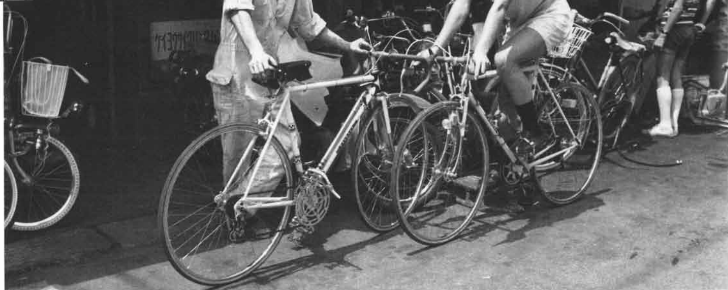
ブジョーPRI0でサイクリングを楽しむお客さま。かなりのマニアとお見受けした。