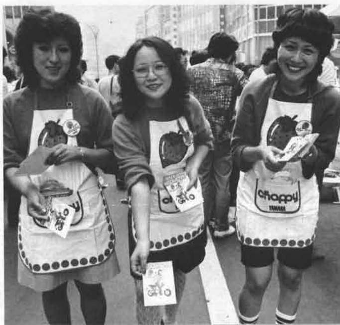
あなたもいかが、チャビィはみんなの新しいクルマです