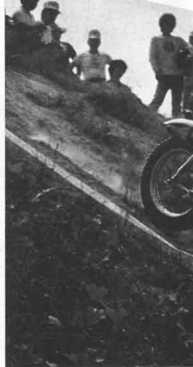
長い急坂を下る。エンジン・ブレ

来日してそうそう、ミック・アンドリュウ選手は日本のオートバイ、モータースポーツ誌の報道関係者と記者会見を行なった。