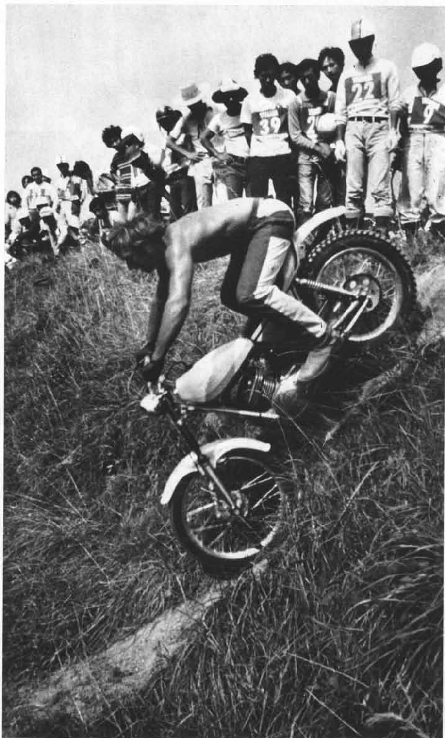
急下降の典型的なフォームを見せてみごとクリーン。後輪は完全に浮上っているが、バランスの乱れはまったくない