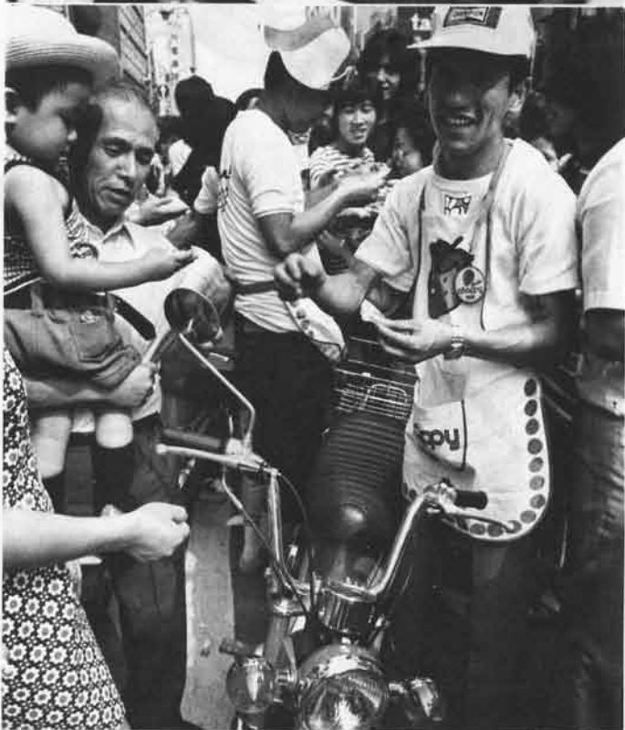
チャビィも人混みにかくれ、最高潮の歩行者天国。このあとチャビィの一陣は歩行者天国から脱出して、再び走りのデモを敢行した