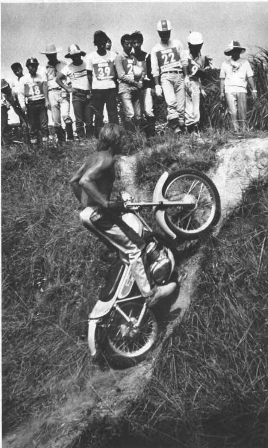
ウワッ、と思わず息を呑んだ超急登坂。腰は殆んどステアリングヘッドにのしかかるようにしてのハンドリングだ