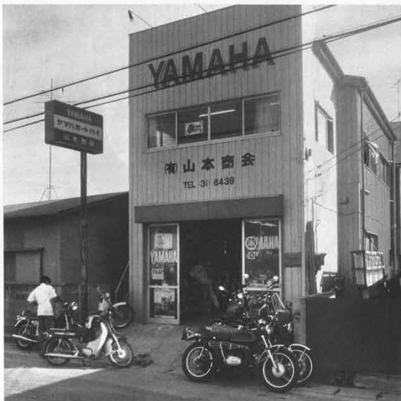
▶ 県道に面した支店全景