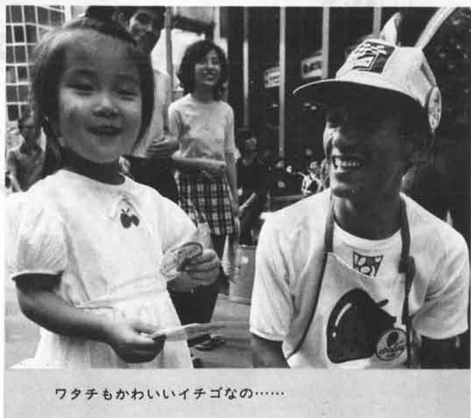
ワタチもかわいいイチゴなの……