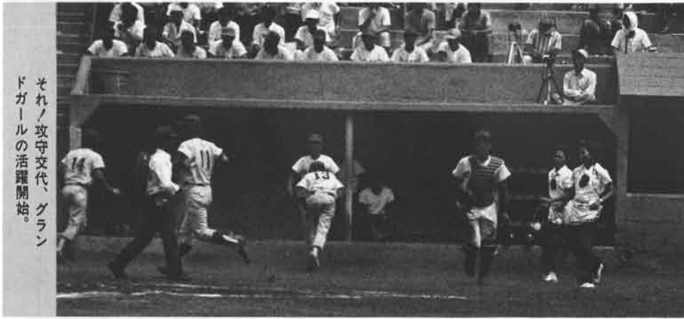
それノ攻守交代、グラウンドガールの活躍開始。

ま夏の風物詩・全国高校野球選手権大会（第五十五回）は、ことしも阪神甲子園球場で連日猛暑を吹きとばす熱戦を展開しています。この甲子園をめざして七月に行なわれた長野県地区予選で、チャピイエプロンも可愛らしいグラウンドガールの活躍が、高校球児たちの健闘にほほえましい姿をそえて人気を呼んでいました。