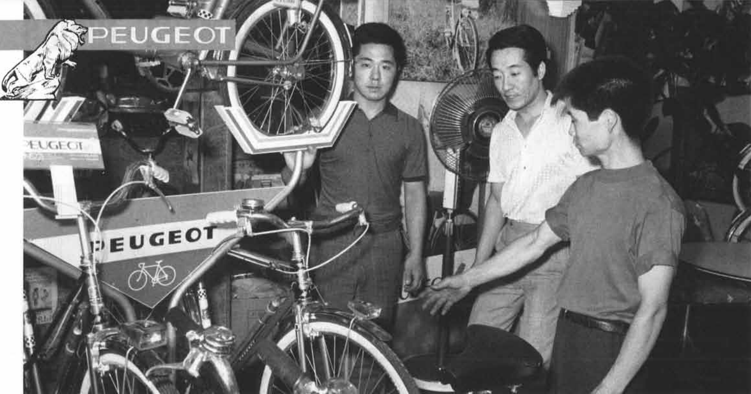
社員の方と、今後の販売作戦を。