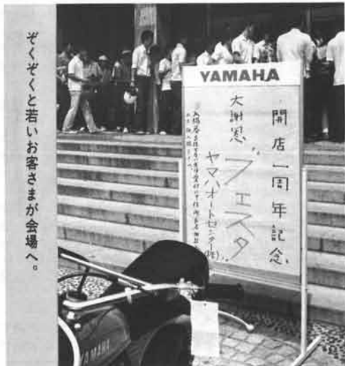
ぞくぞくと若いお客さまが会場へ。