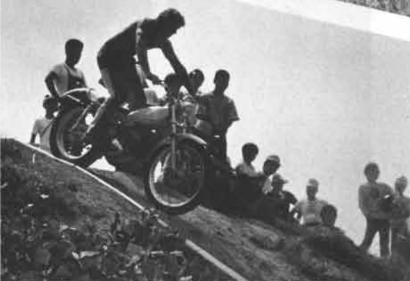
ハンドルをきりおわると同時にアクセルをわずか吹かして、前輪をあげ、急激に方向転回をすませ、あとは谷側に体重をかけスルスルと登っていく