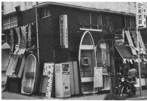
三祐釣具店・長崎