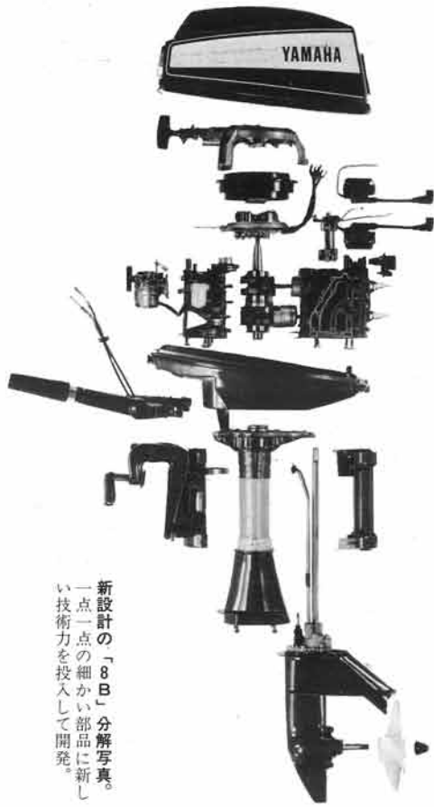
新設計の「8B」分解写真。一点一点の細かい部品に新しい技術力を投入して開発。

以上、常に苛酷な条件で使われる船外機の特質をあらゆる角度から検討し、高度な技術力を結集して開発したものがこの「8B」で自信を持ってご商売いただけるものと仕上げてあります。