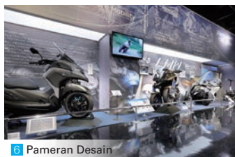
6 Pameran Desain