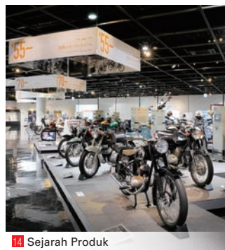
14 Sejarah Produk