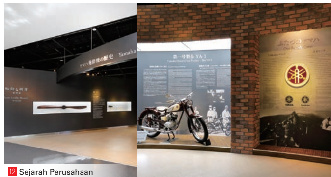
12 Sejarah Perusahaan