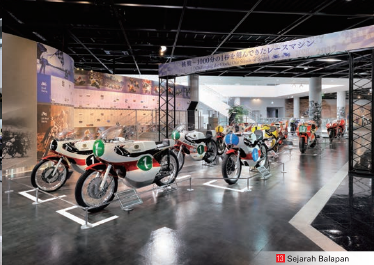
13 Sejarah Balapan