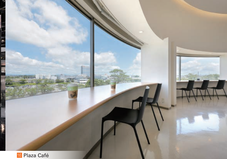
16 Plaza Café