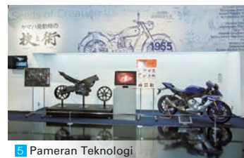
5 Pameran Teknologi

Memamerkan produk-produk yang digunakan dan dicintai orang di seluruh dunia di kehidupan sehari-hari di darat, laut, udara, mulai dari sepeda motor, perahu, motor temple, mobil salju, kendaraan segala medan, mesin mobil, sepeda hibrida listrik, kursi roda listrik, mobil golf, helicopter tak-berawak untuk industri, generator dan robot industri.