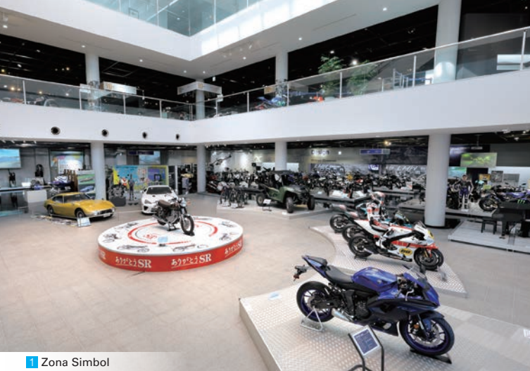
1 Zona Simbol