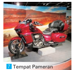
7 Tempat Pameran