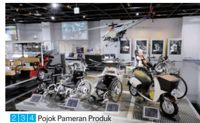
2 3 4 Pojok Pameran Produk